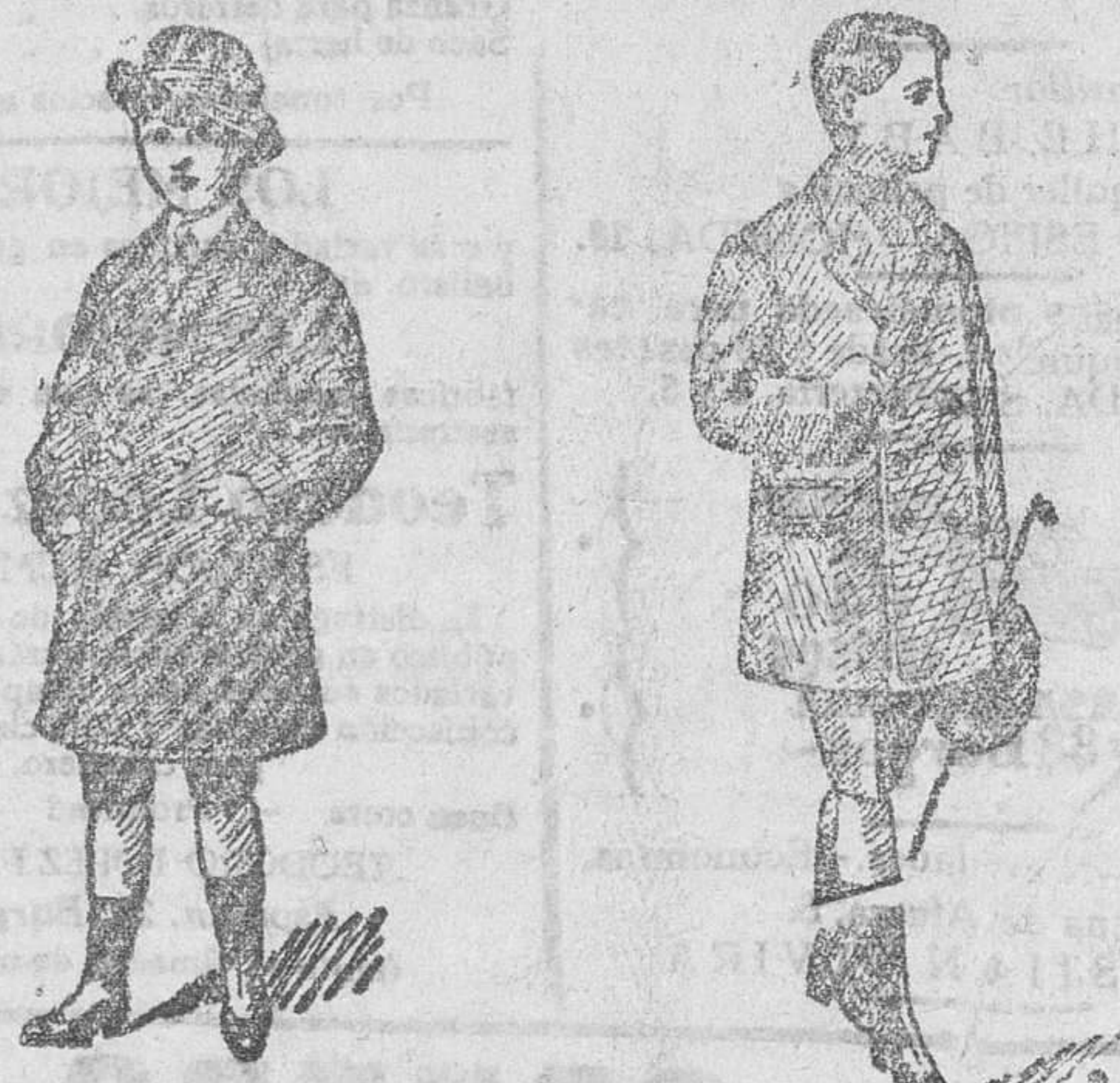
1.000 abrigos para niños, diversidad de modelos, a 16, 20 y 25 pesetas Precio fijo verdad. Todos los artículos marcados.