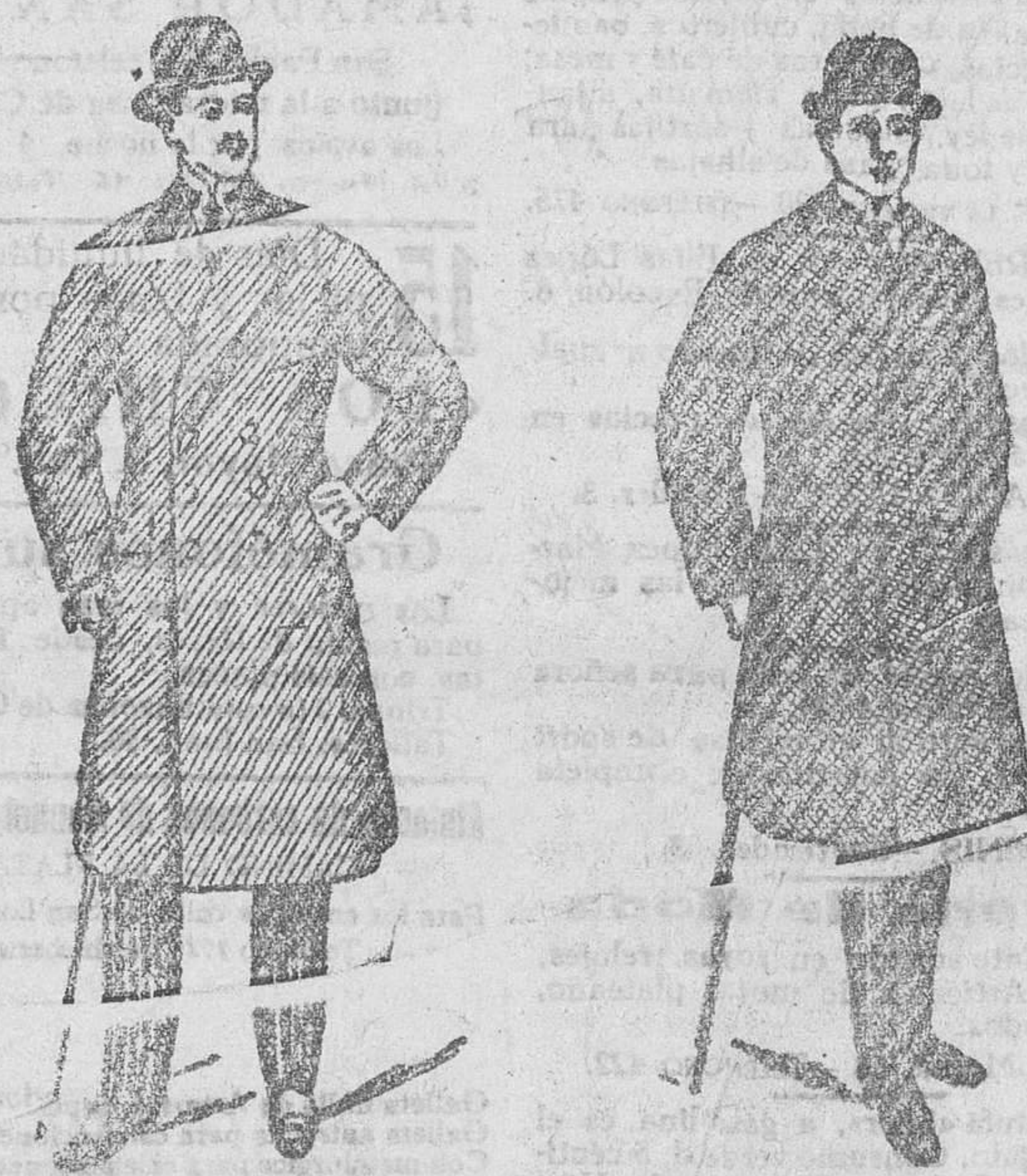
2.000 gabanes para caballero, a 40, 50, 60, 70, 90, 100 y 150 pesetas

Gran casa de trajes, paños y confecciones de caballeros, señoras y niños.