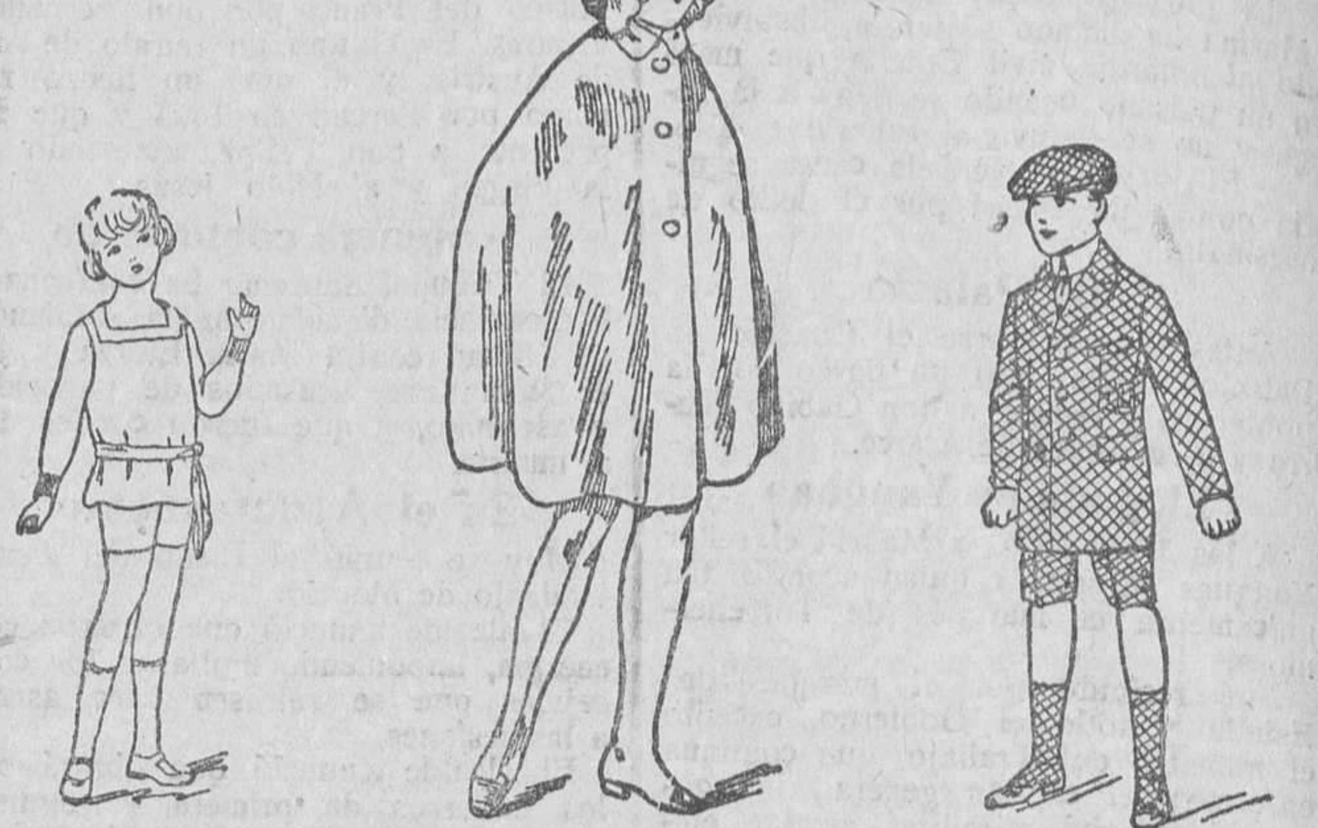
Trajecitos niño, a 16, 18, 20 y 25 pesetas. Capas impermeables, de 10, 12, 15 y 20 pesetas, según tallas. Trajecitos de punto para niños, de lana y algodón, de 8 a 25 pts.

Gran casa de tejidos, pañería y confecciones de caballero, señora y niños