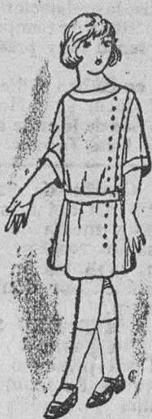
Diversidad de modelos en vestiditos de percal y batista, 2'50 a 10 pesetas.