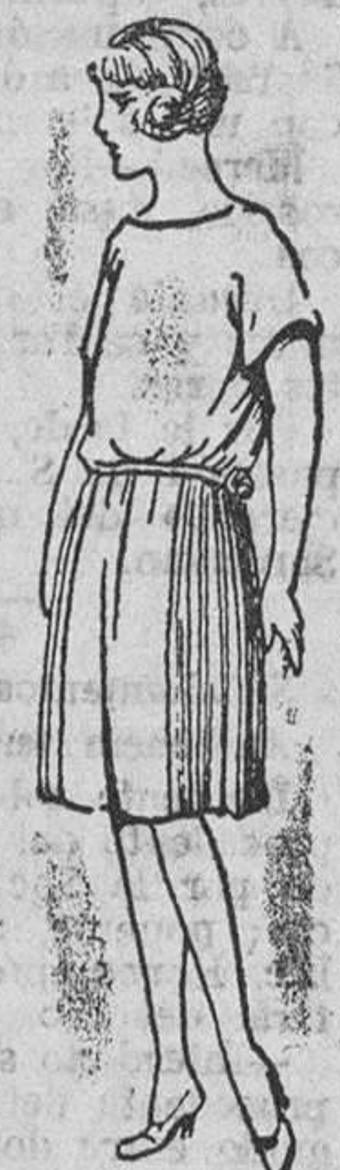
Diversidad de modelos en vestiditos de lana, de gran novedad, para niños y jovencitas.

Precio fijo verdad. Todos los artículos marcados.