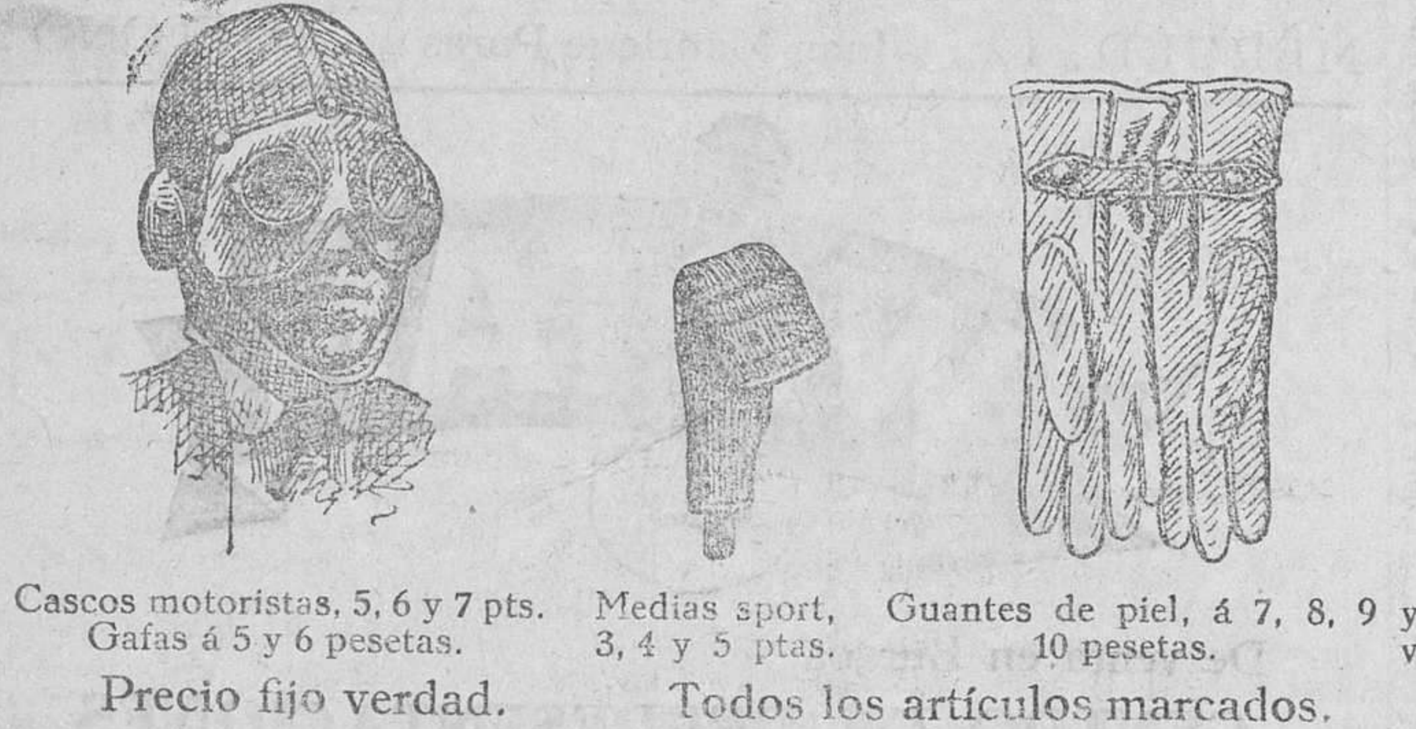
Cascos motoristas, 5, 6 y 7 pts. Gafas á 5 y 6 pesetas. Medias sport, 3, 4 y 5 ptas. Guantes de piel, á 7, 8, 9 y 10 pesetas. Precio fijo verdad. Todos los artículos marcados.