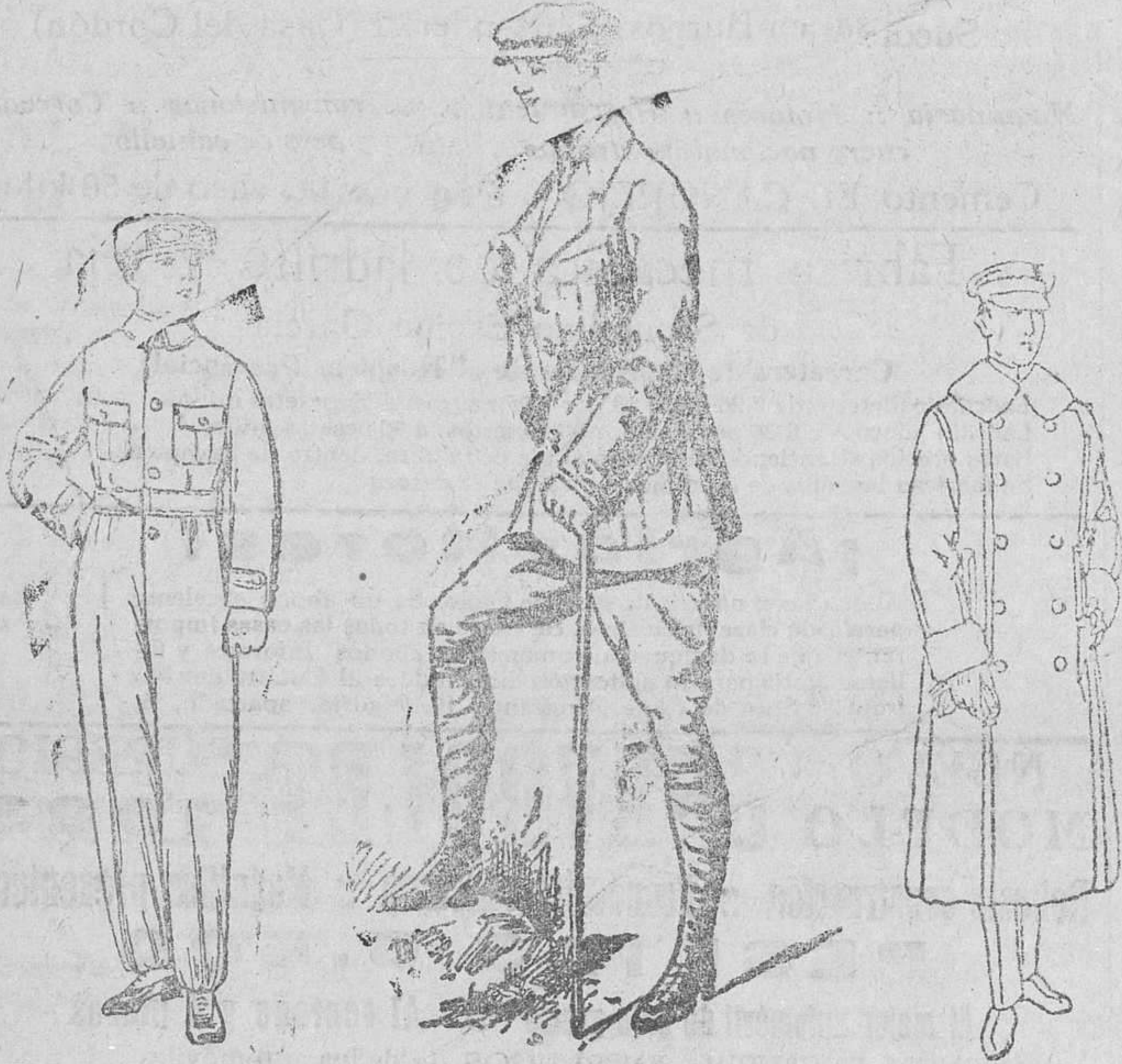
Buzos azules y color kaki, 16, 18, 20 y 25 pts. Trajes sport, en paño, pana y dril, desde 35 á 120 pesetas. Guardapolvo soffer á 22, 25 y 28 ptas.

Gran casa de tejidos, pañería y confecciones de caballero, señora y niños