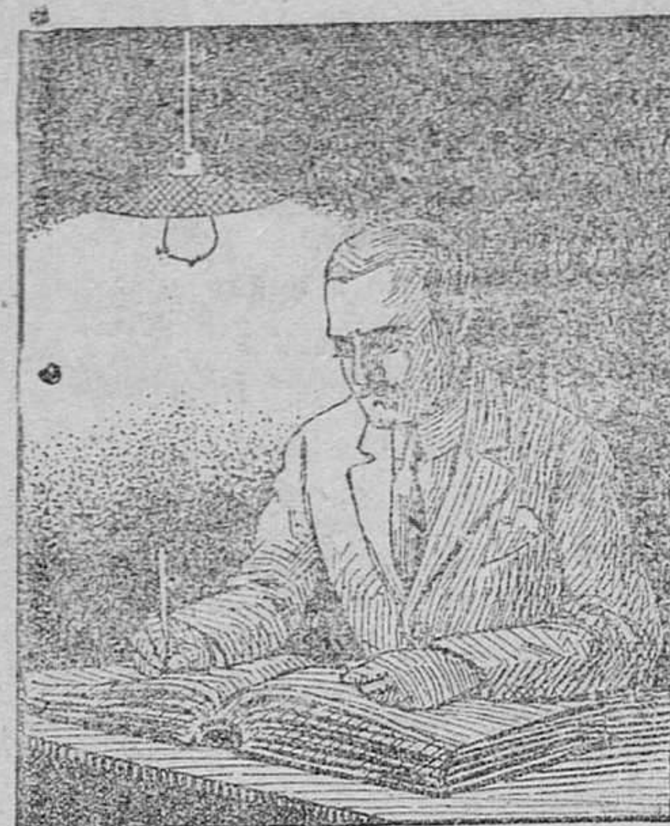
TRABAJANDO CON LÁMPARA DE FILAMENTO METÁLICO