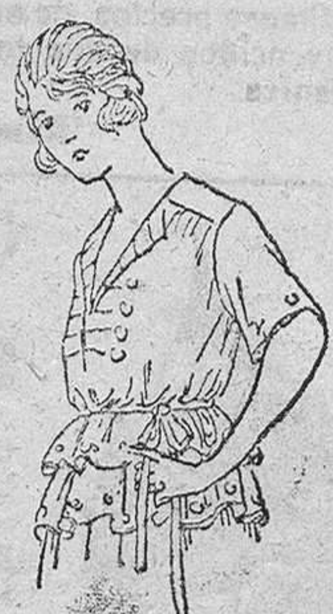
Gerecys lana, en colores novedad, á 15, 18, 20 y 25 pts.