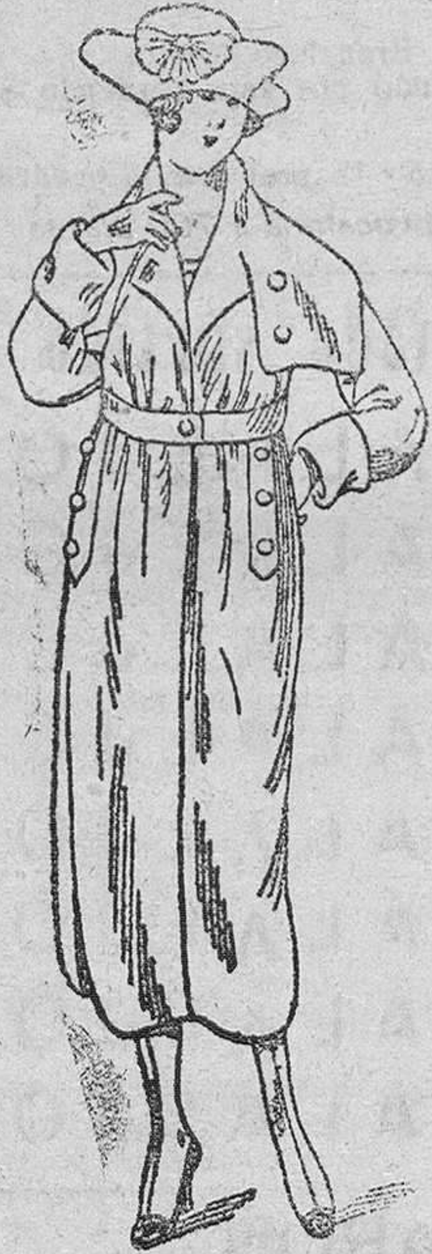
Abrigos novedad, en gamuzas, desde 35 á 150 pts.

Primera casa en confeccionar de caballero, señora, niñas y niños