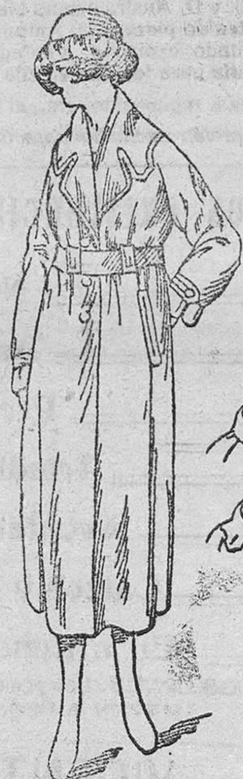
Gabardinas señora, desde 100 á 140 pts.