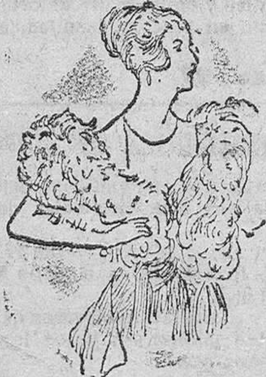
Cuellos de pluma «Saldo» desde 25 á 65 pts.