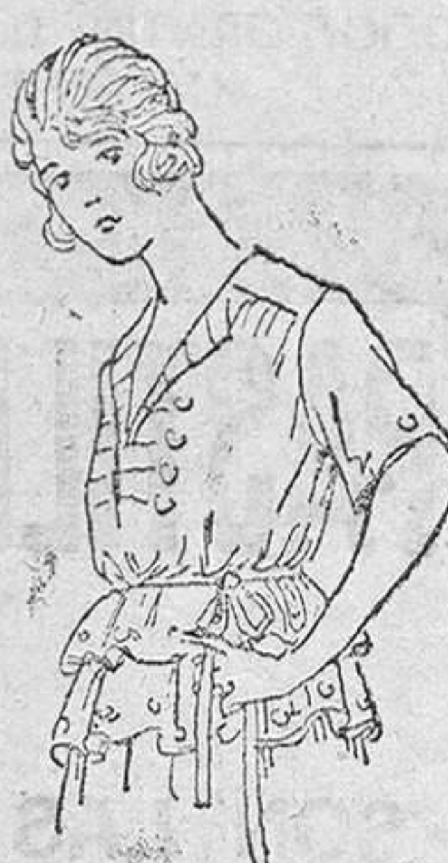
Jerseys lana, en colores novedad, á 15, 18, 20 y 25 pts.