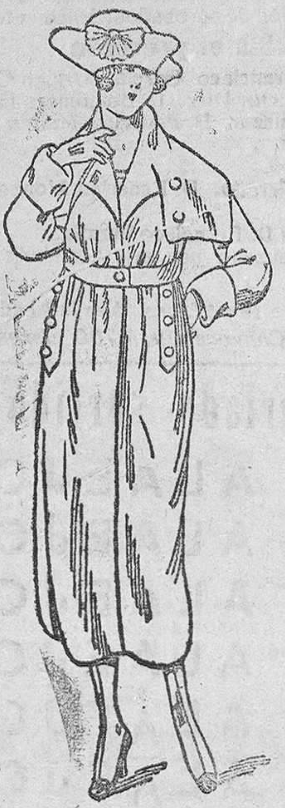
Abrigos novedad, en gamuzas, desde 35 á 150 pts.

CASA MUNGUIA. (Sucesor de Rebollo) Viana Mayor, 42, y Lain-Calvo, 9.-Teléfono núm. 88.-Burgos Primera casa en confecciones de caballero, señora, niños y niñas