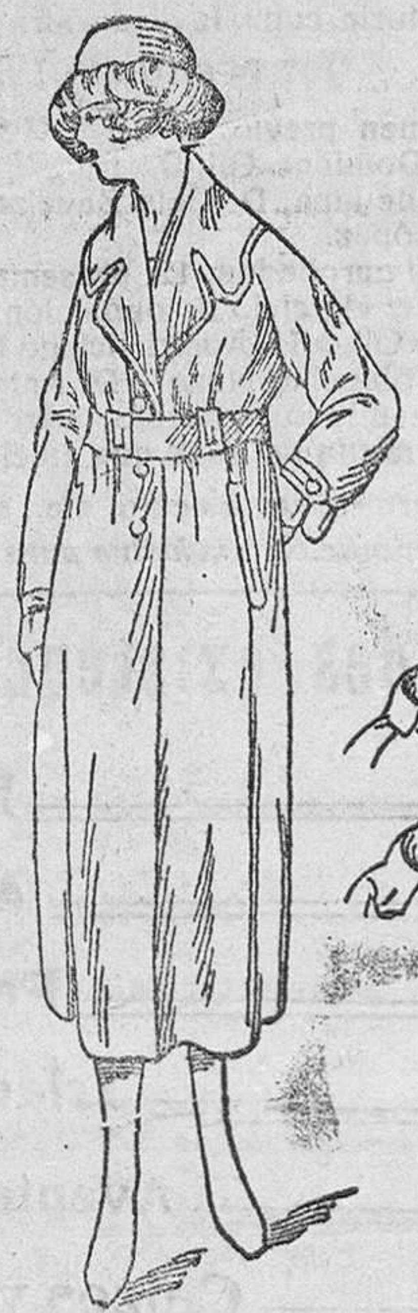
Gabardinas señora, desde 100 á 140 pts.