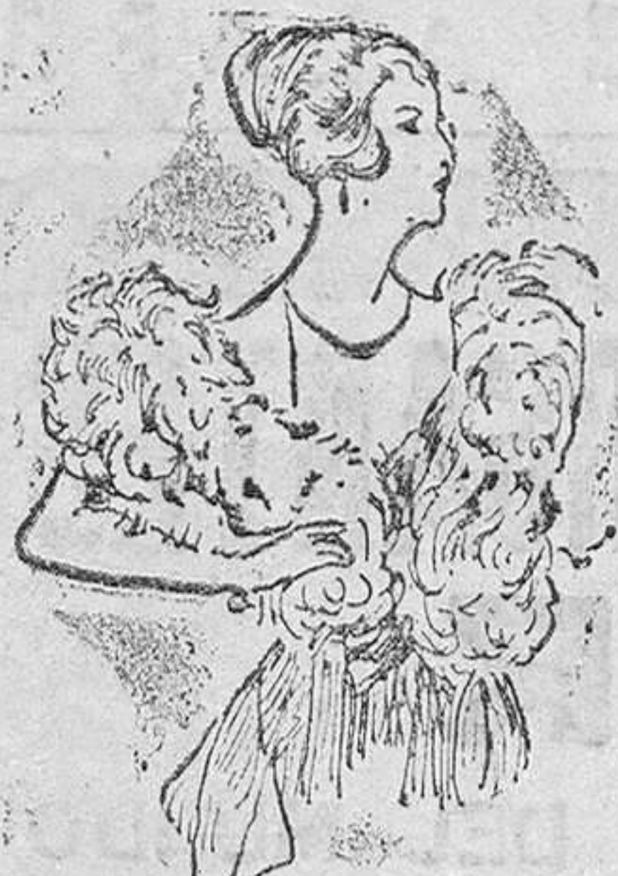
Cuellos de pluma «Saldo» desde 25 á 65 pts.