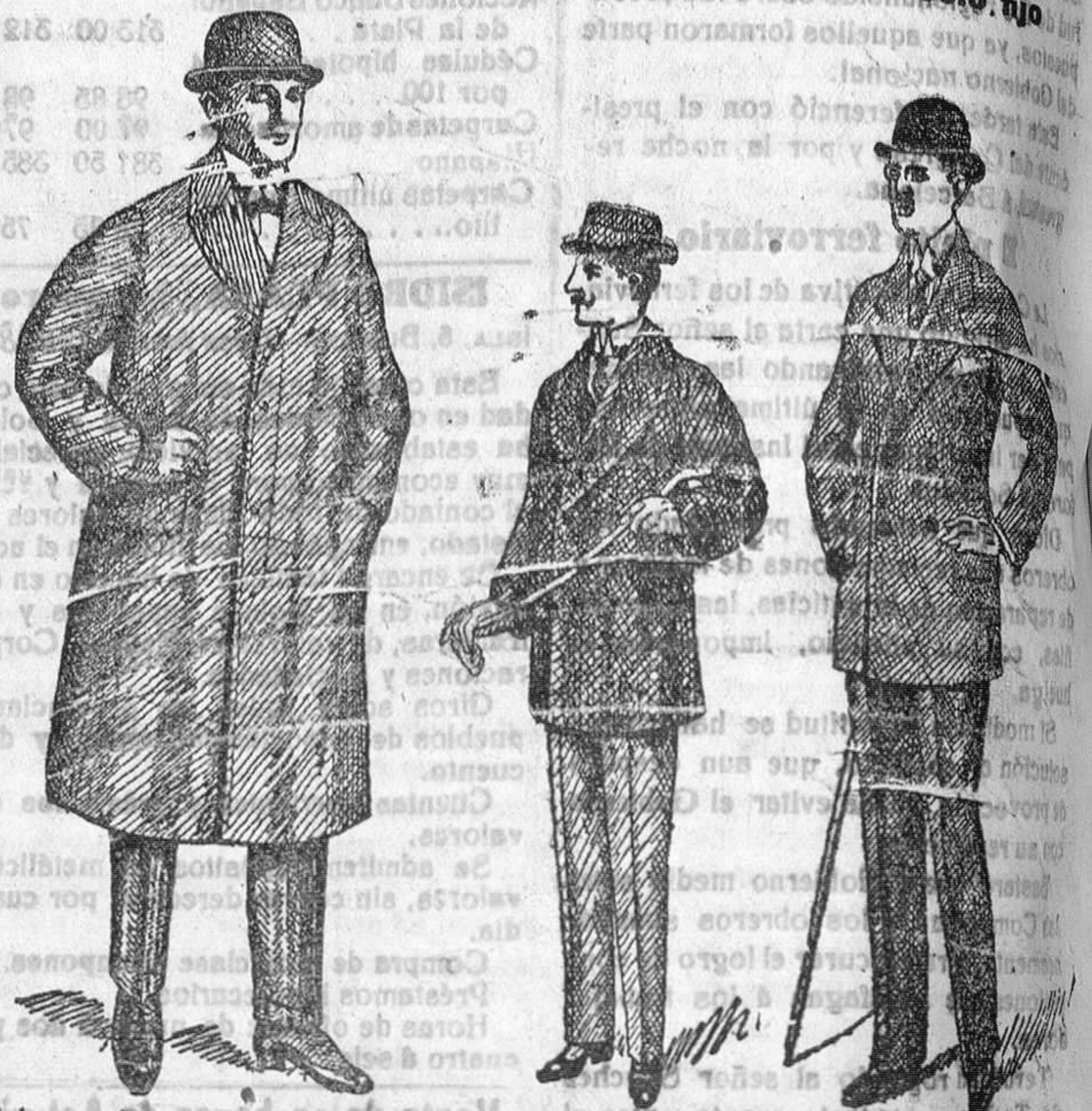
Gabanes de caballero y jóve.—Pellizas desde 18 á 75 pesetas. Trajes paño de 30 á 70 pesetas, desde 40 á 125 pesetas. pana de 35 á 60 pesetas. Siempre últimas novedades. Grandes surtidos. dril de 20 á 35

Siempre a precios económicos — Precio fijo.