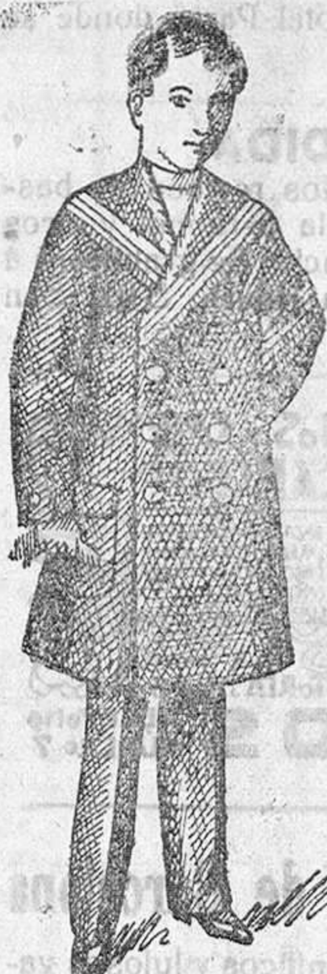
GRANDES SURTIDOS recibidos para la próxima temporada en gabanes de jóvenes y niños.