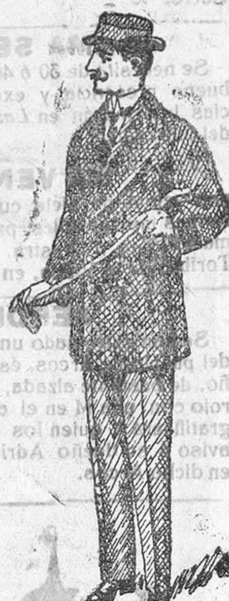
Pellizas desde 18 á 75 pesetas. Grandes surtidos