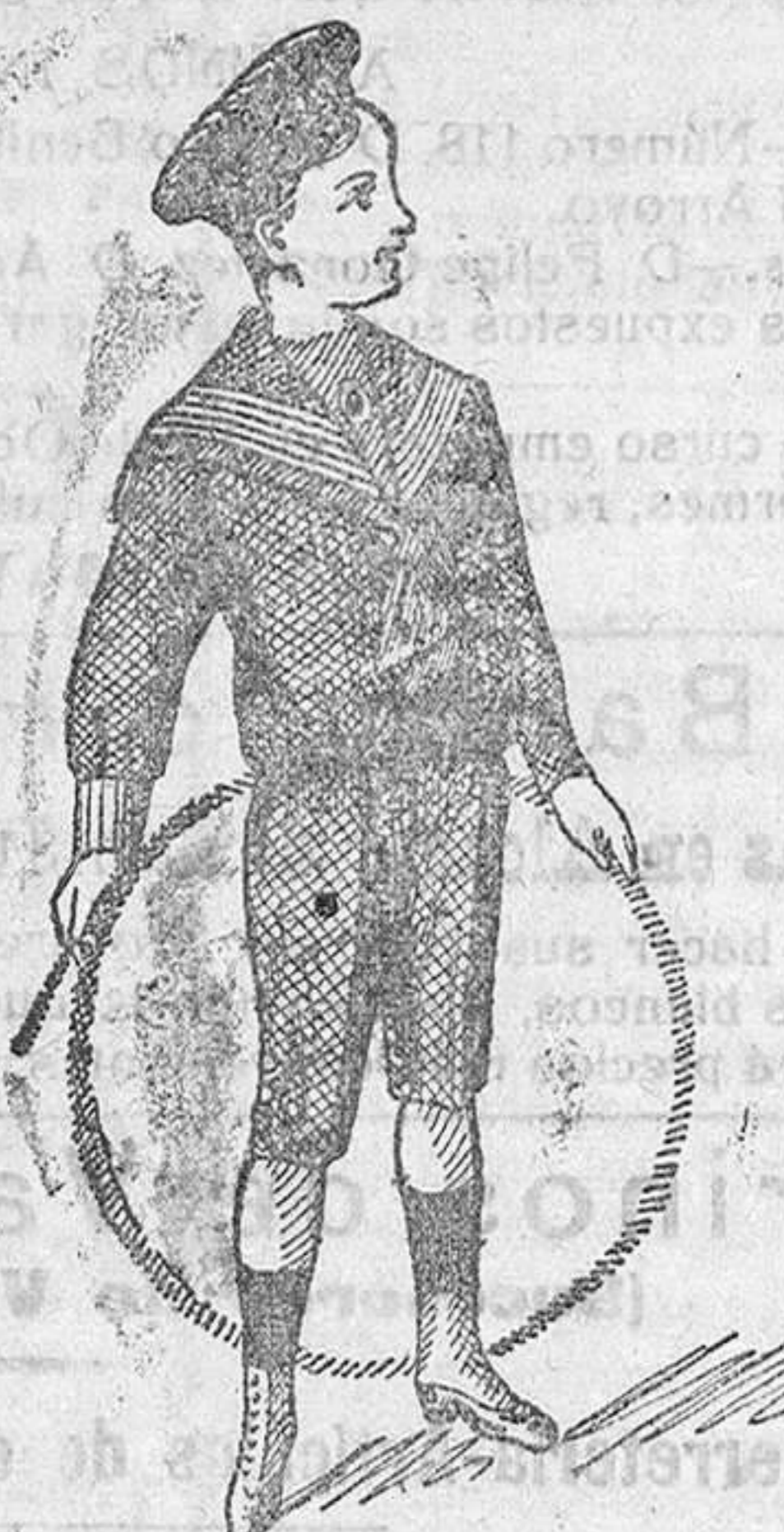
50 modelos diferentes en traje- citos de niños, en paño, jergas, vicuñas y panas.