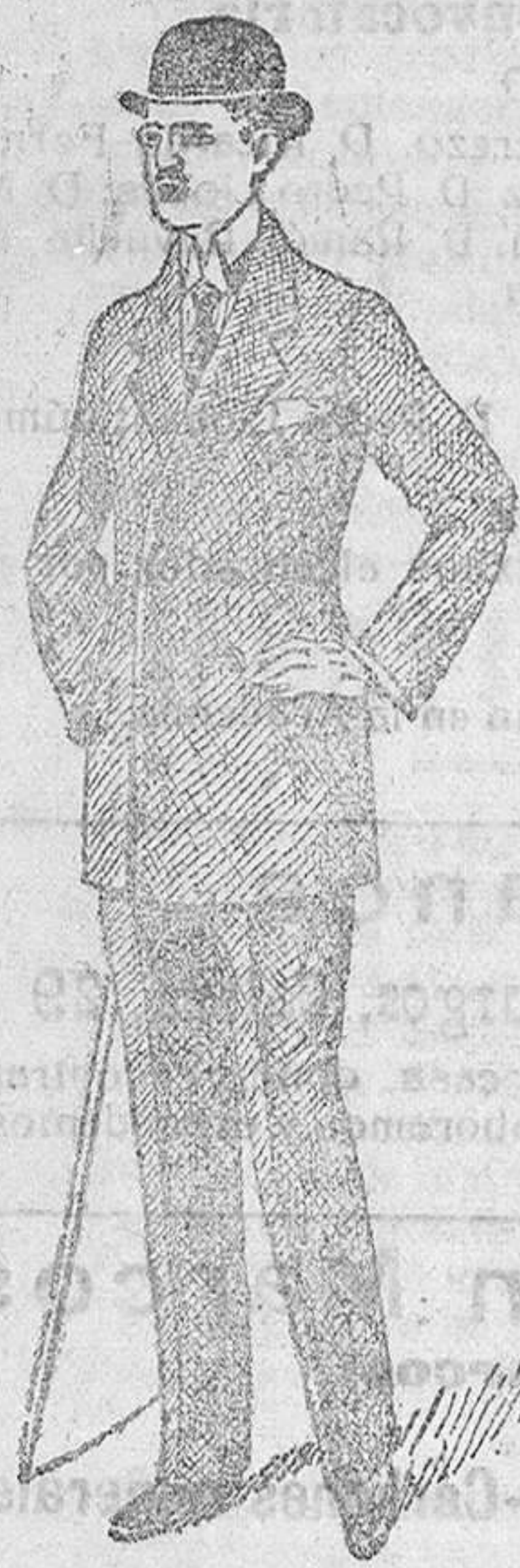
Trajes paño de 30 á 70 pías. pana de 25 á 60 dril de 20 á 35

Esta casa es la única que presenta siempre grandes surtidos en tejidos y ropas confeccionadas de caballero, señora, jovencitos, niños y niñas.