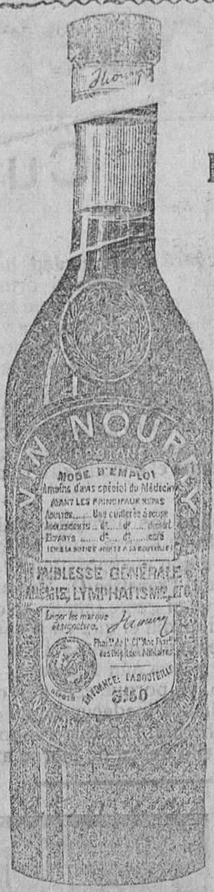
Se vende en toda Farmacia acreditada.

Soberano contra: DEBILIDAD GENERAL ANEMIA LINFATISMO ENFERMEDADES del PEGHO