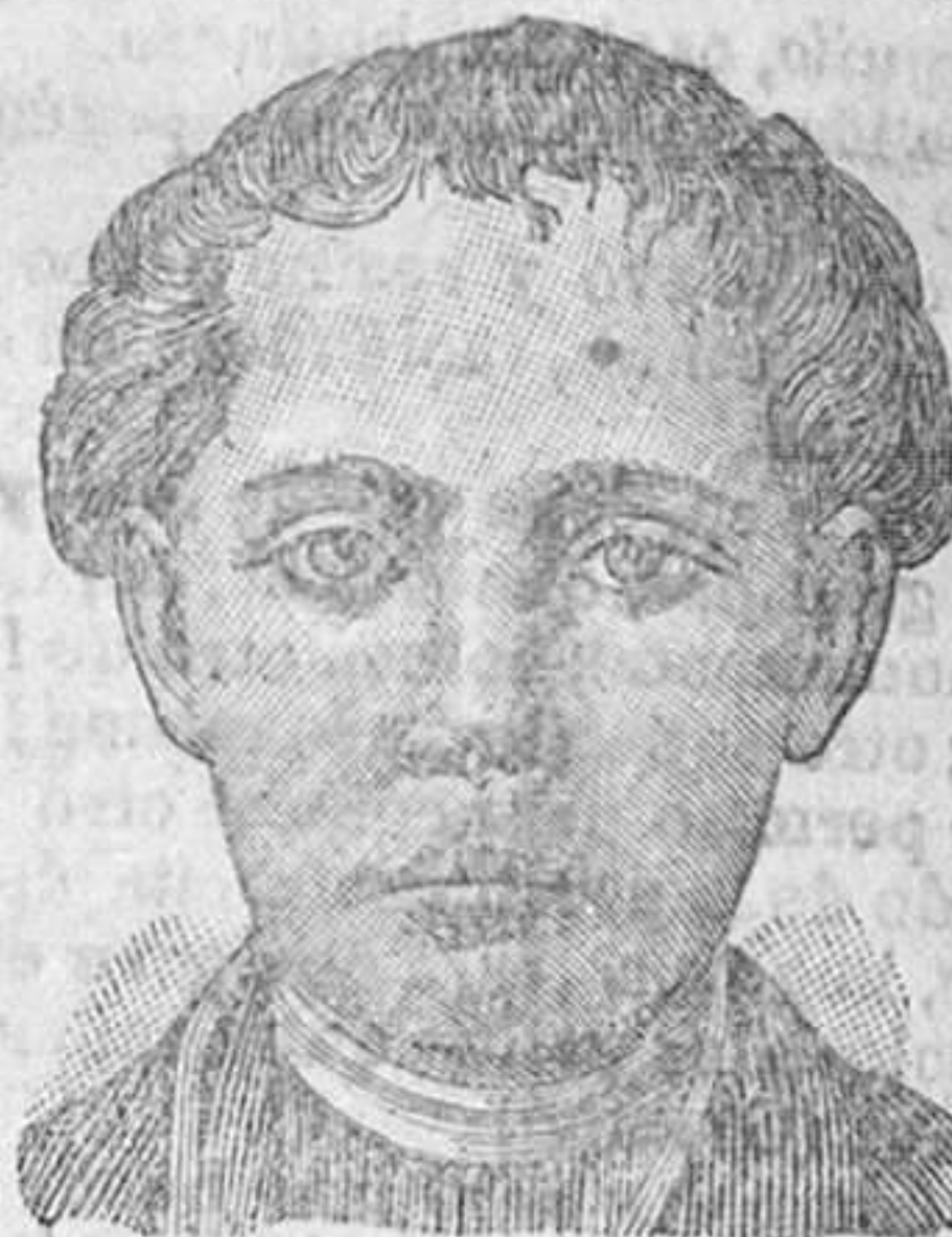
A los 15 días de tratamiento.