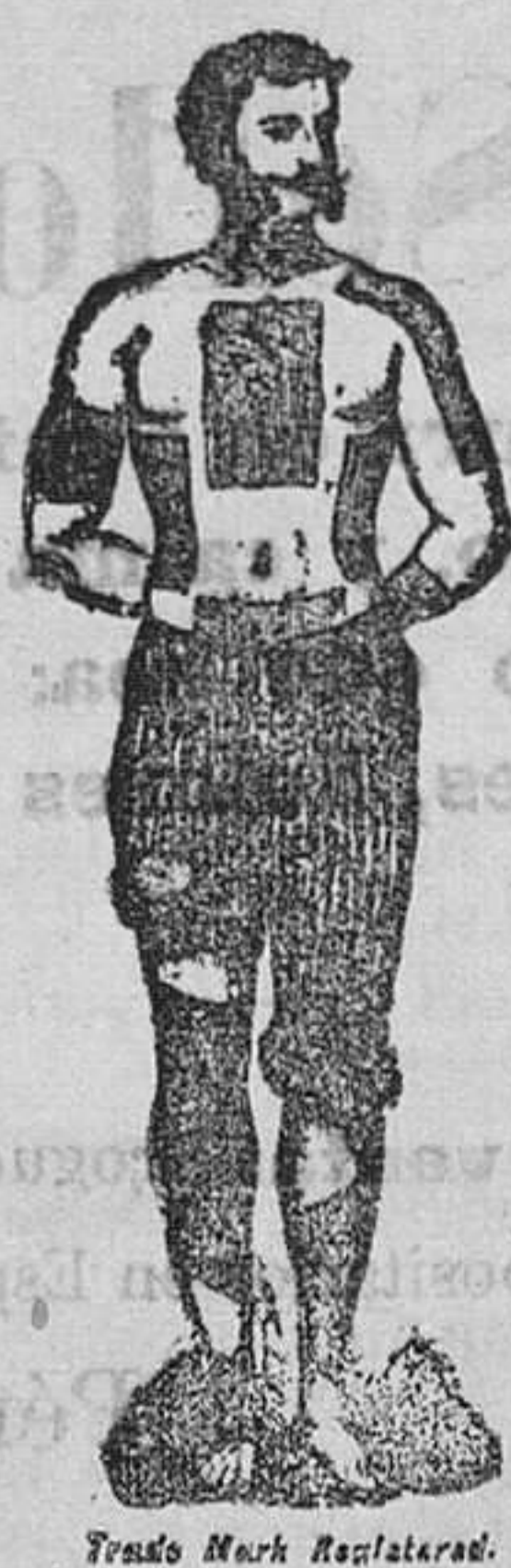
Trade Mark Registered.

Los Emplastos de fieltro rojo de Winter CURAN lumbago, ciática y otros dolores de este género.