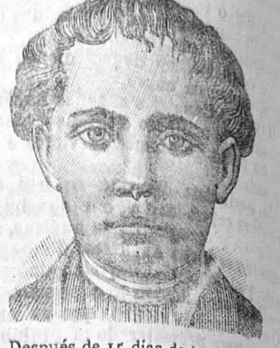
Después de 15 días de tratamiento

Hemos señalado a los lectores de este periódico el descubrimiento sensacional del Sr. RICHELET, farmacéutico y químico en Sedán de Francia, en lo que toca a las enfermedades de la piel. Aquí la lista de estas enfermedades que han sido curadas después de algunos días, por este tratamiento maravilloso: Escama, herpes, impetigo, acnes, sarpullidos, prurigos, rojeces, sarpullidos tarintosos, sycosis de la barba, comezónes, varices, llagas varicosas y eczemas varicosas de las piernas, enfermedades sifilíticas.