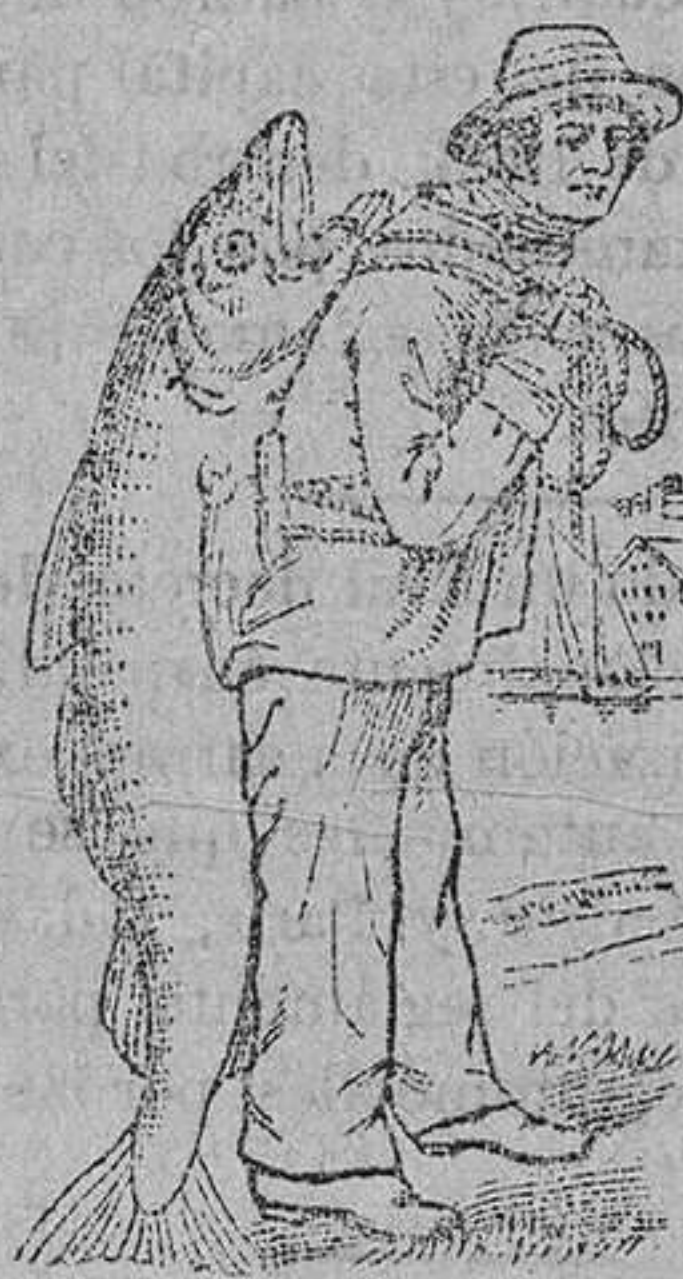
Islas de Lofoden (Noruega) 1902.

Desde muchos años yo pisco para ustedes el mejor bacalao que nada en estos mares, y este bacalao de Lofoden es el mejor del mundo. De estos bacalaoes que yo pisco con anzuelo y largo curricán, yo reservo para Vds. exclusivamente los de primera calidad. En todos los años que trabajo para Vds. nunca les he dado un pescado de calidad inferior. Esta es la razon de la extraordinaria calidad curativa del aceite que yo extraigo para Vds. de los higados de esos pescados y siempre ha sido de primera calidad de la producción noruega, que es la mas superior del mundo. Si el buen pueblo español quiere cosas de primera y no de inferior calidad, pedirá siempre la Emulsión Scott que lleva en el envoltorio la etiqueta que representa un gran bacalao de Lofoden á cuestas de su S. S.