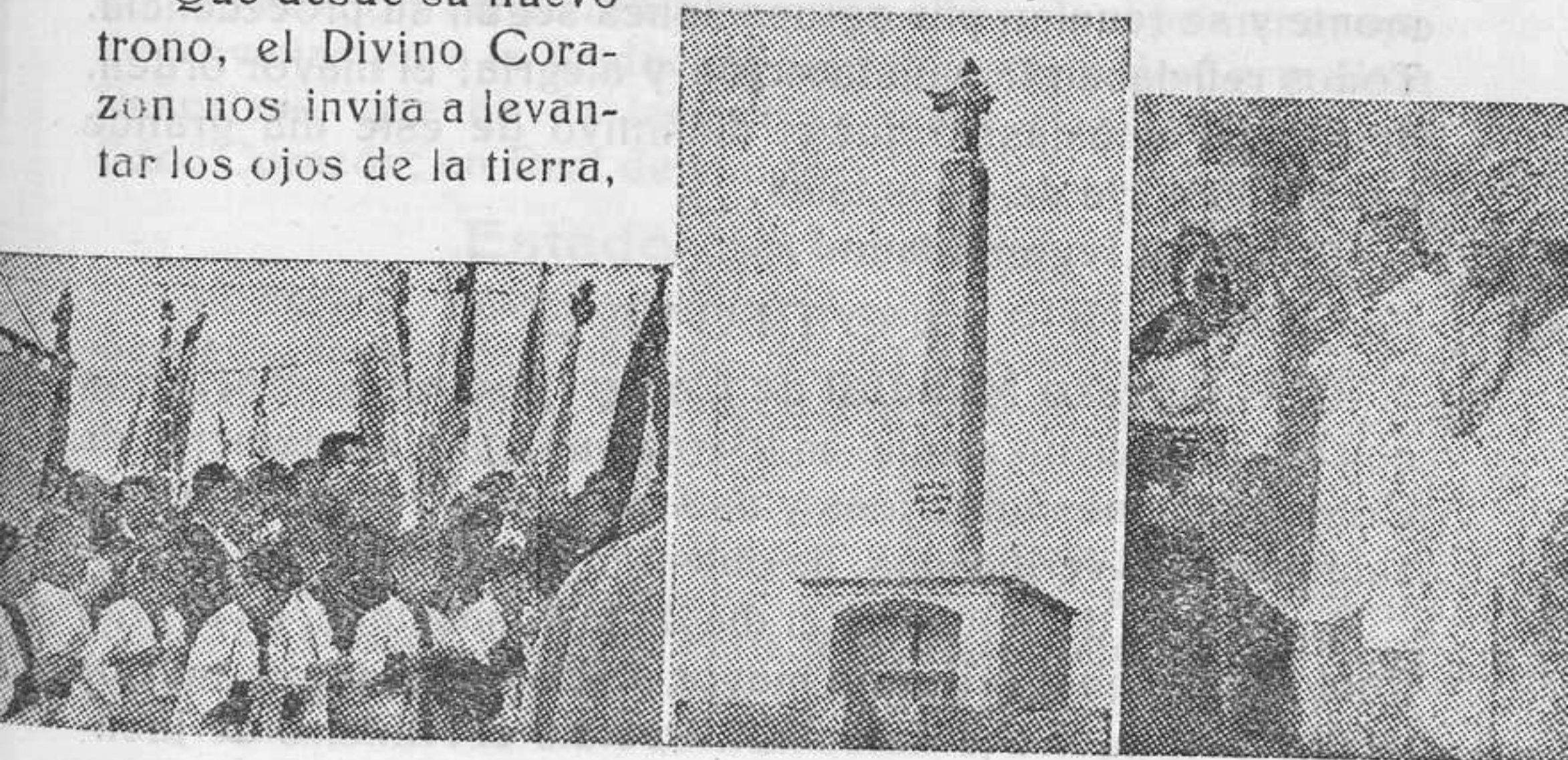
Bendición del magnífico Monumento diocesano de Ibiza al Sdo. Corazón, el 12 de octubre de 1947

Que desde su nuevo trono, el Divino Corazón nos invita a levantar los ojos de la tierra,