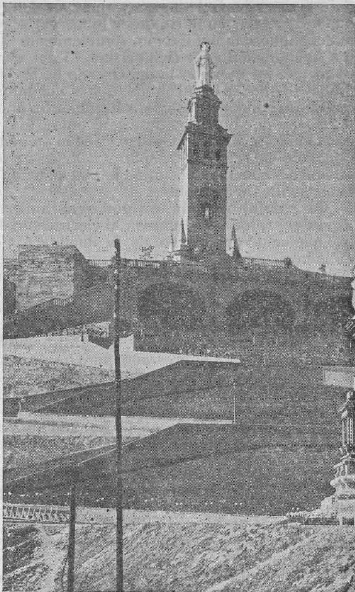
Monumento al Sdo. Corazón de Jesús, sobre el Cerro de S. Juan de Aznalfarache, (Sevilla) ET