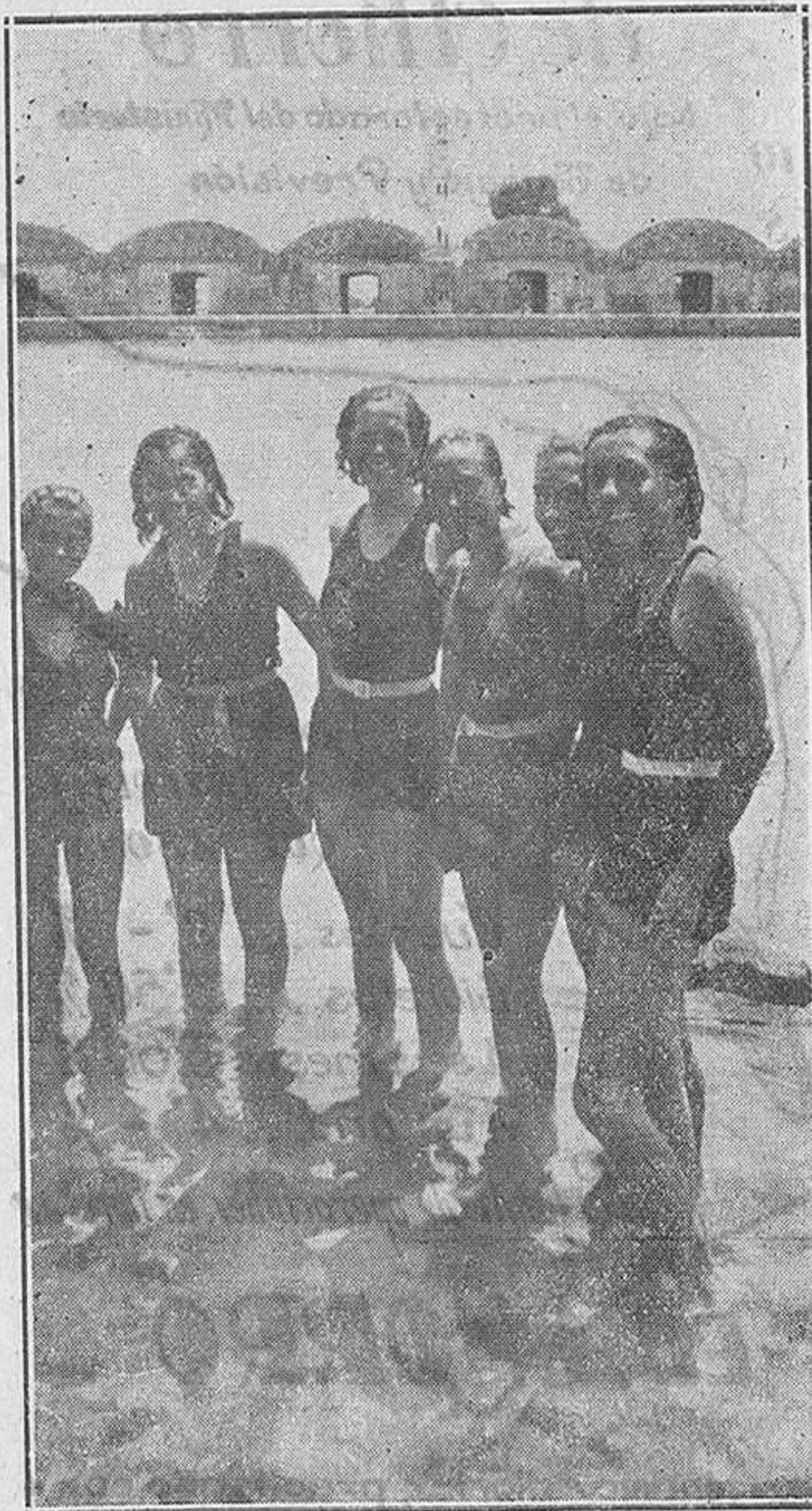
Equipo femenino... Rostros alegres, cuerpos fuertes, sin perder la gracia...