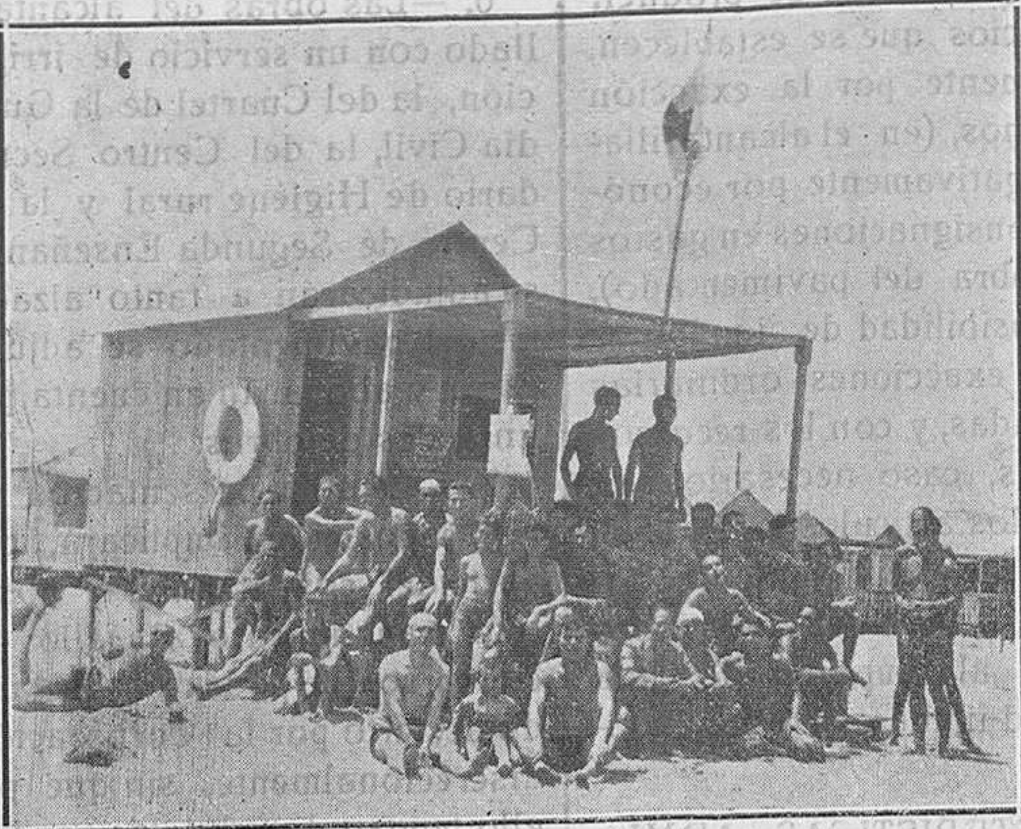
Una caseta de salvamento... Altruismo, siempre atento el Club por si se produce el peligro para algún bañista...

Esperanzador en gran manera el espectáculo que ofrece tanto joven en despreocupación — no en descocada exhibición — practicando en nuestra playa el deporte favorito. Quién juega al fútbol por sólo el ejercicio que ello representa; quién corre, quién nada, boxea, practica el salto desde el trampolín. Lanzan jabalina a disco. ¡Preciosas, clásicas actitudes llenas de una elegancia helénica! — ¡oh! el discóbolo famoso — muestran estos jóvenes de tostada piel, re-