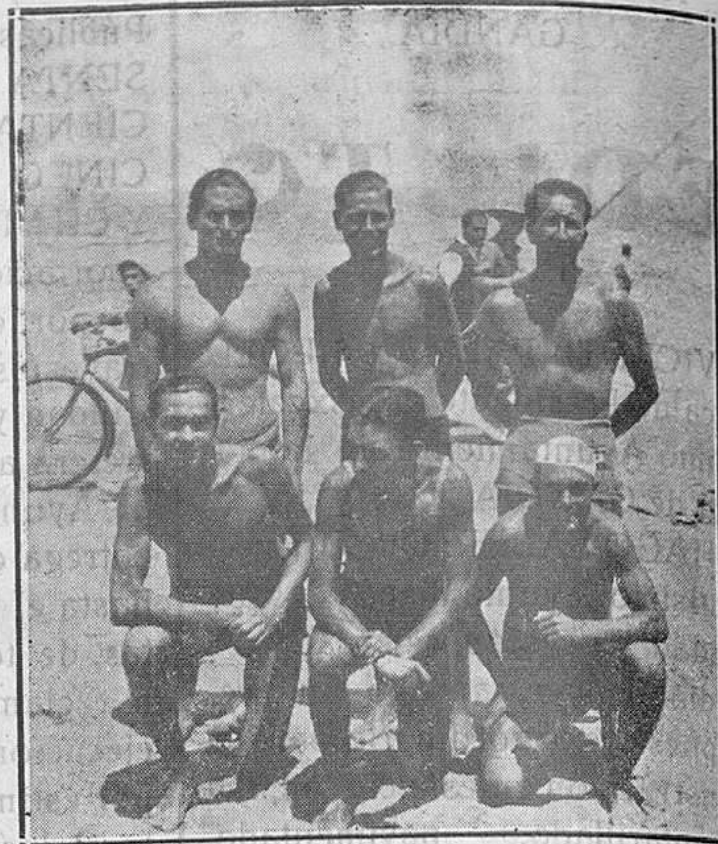
Equipo relevos estilos...

Una caseta en la playa tiene instalada el Club, hija de su potencialidad y altruismo. Es de salvamento. Bien equipada, durante las horas en que pueden haber bañistas en el agua existe un socio — o socios — de guardia por si algún semejante, por fatal accidente, necesitara del auxilio de un experto nadador. Allí un botiquín para asistencia rápida, un rollo y chaleco salvavidas... y la voluntad de un Club que, de corazón, presta apoyo altruista en circunstancias en que puede producirse el peligro... Existe un ambiente de agradecimiento