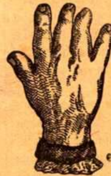
Antes de usar la POMADA ADROVER