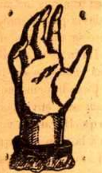
Después de usar la POMADA ADROVER

PRECIO: DOS REALES CAJA DE VENTA EN TODAS LAS FARMACIAS