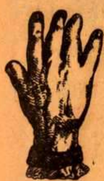
Antes de usar la Pomada Adrover