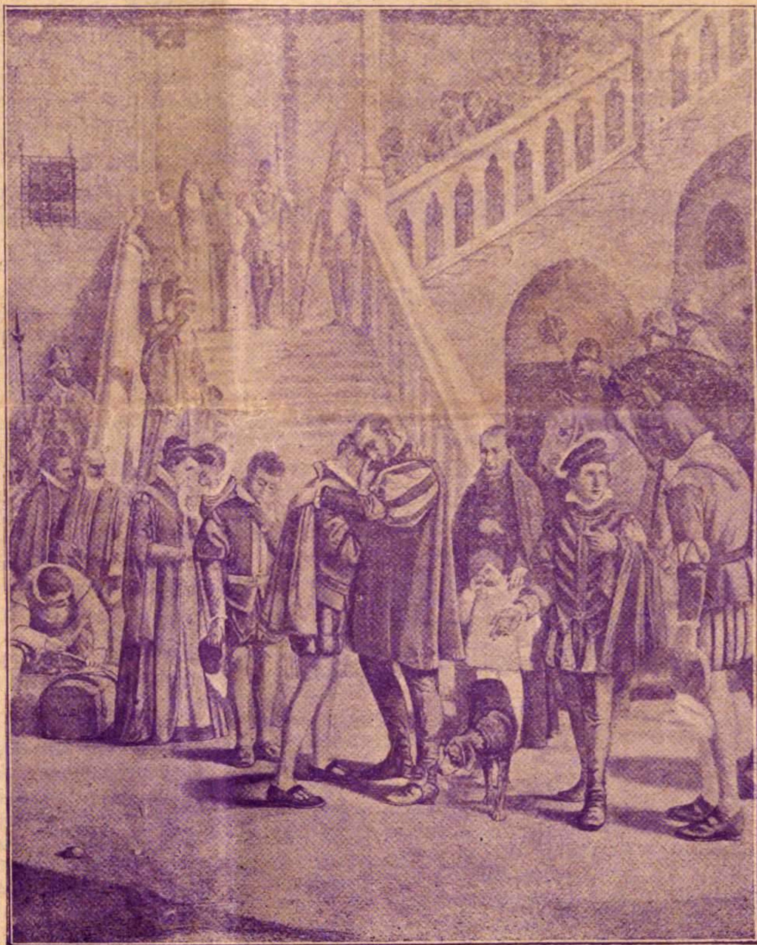
Despedida de San Francisco de Borja

Contempladle abrazando á su hijo primogénito al pié de aquella misma escalera que en estos alegres días se ve invadida por millares de fieles que acuden á honrar la memoria del gran Santo que tantas veces la pisó. Pero ¡oh triste fin de las humanas grandezas! Esta escalera que tantas veces vió á Francisco acompañado de los más linajudos y esclarecidos próceres y magnates, ya no volverá á con-