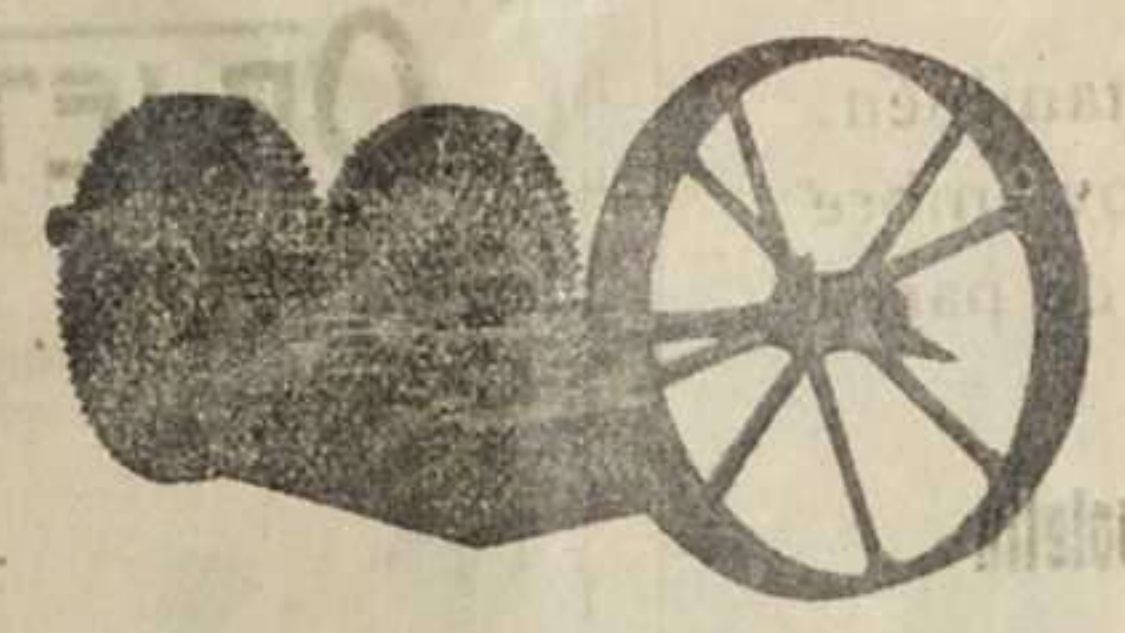
Cab-zal especial para bombas triples si enciosas