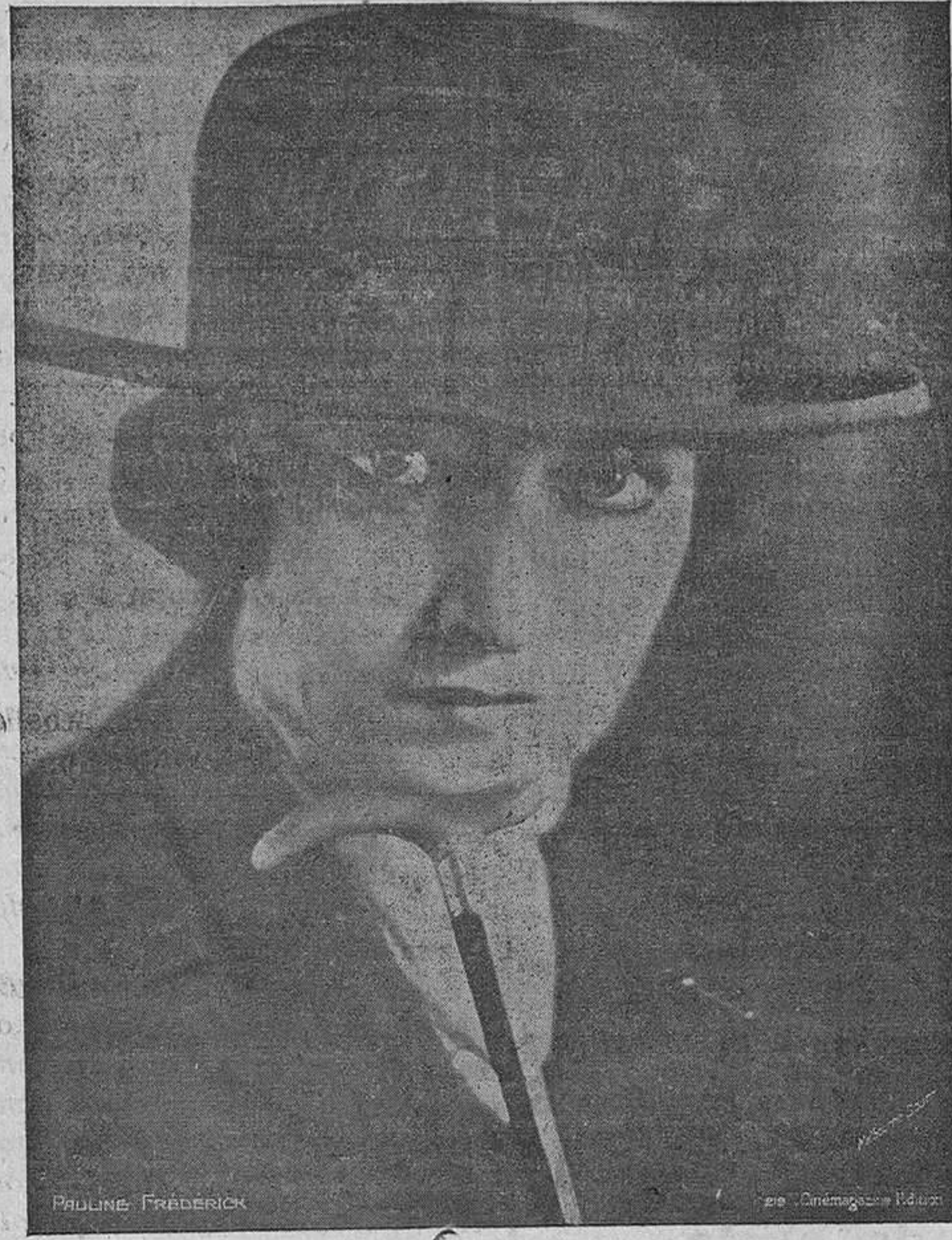
Pauline Frederick. Una de las más sutiles «estrellas» cinematográficas de la constelación americana...