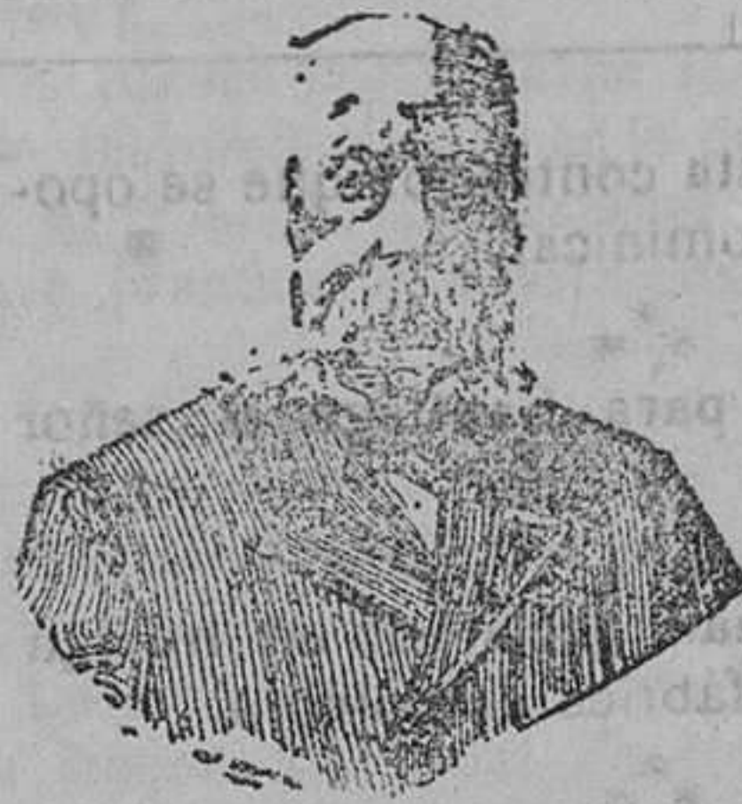
A. CHARLES LAMBERT DEPÓSITO GENERAL: Calle Aragón 402, BARCELONA.

Farmacia Paradell, Cortes (Granvía), 151.-BARCELONA