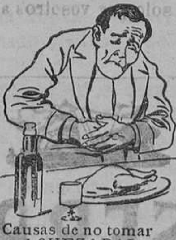
Causas de no tomar el QUEZARAL