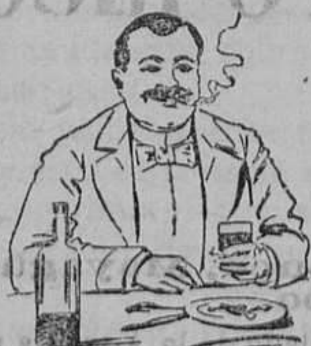
Efectos de haber tomado el QUEZARAL