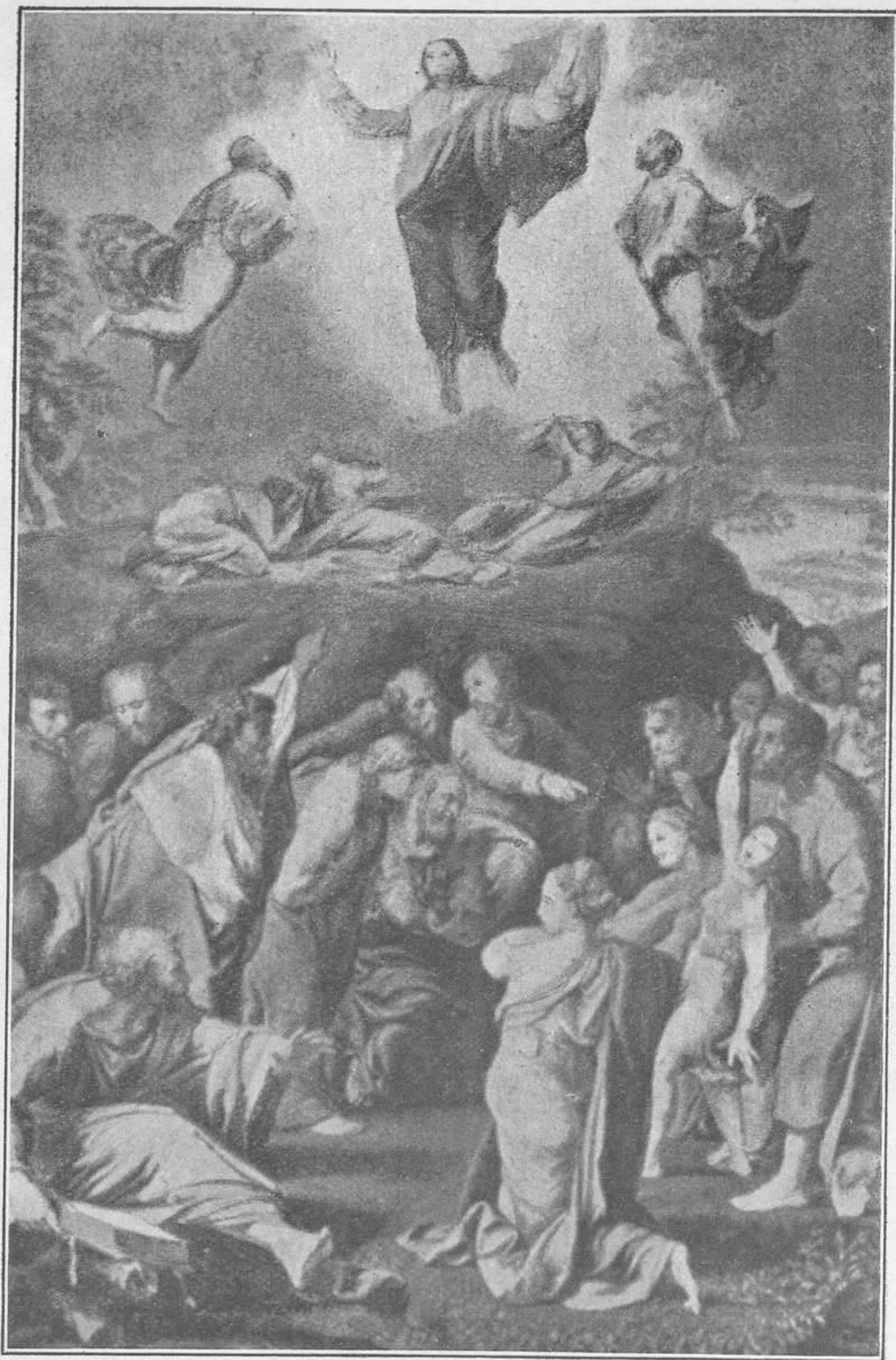
LA TRANSFIGURACIÓN DEL SEÑOR