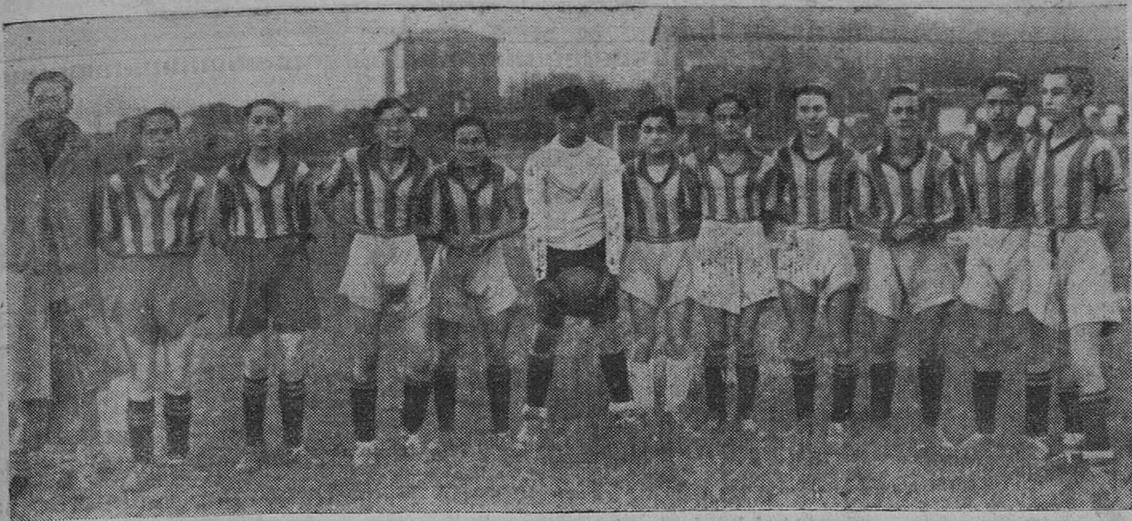
LOS CLUBS MODESTOS. — Uno de los clubs de mejor juego y de mayor deportividad, y en el que desuculan equipiers que son verdaderas esperanzas en el deporte cantabro, es el Tolosa Sport, cuya fotografía publicamos.