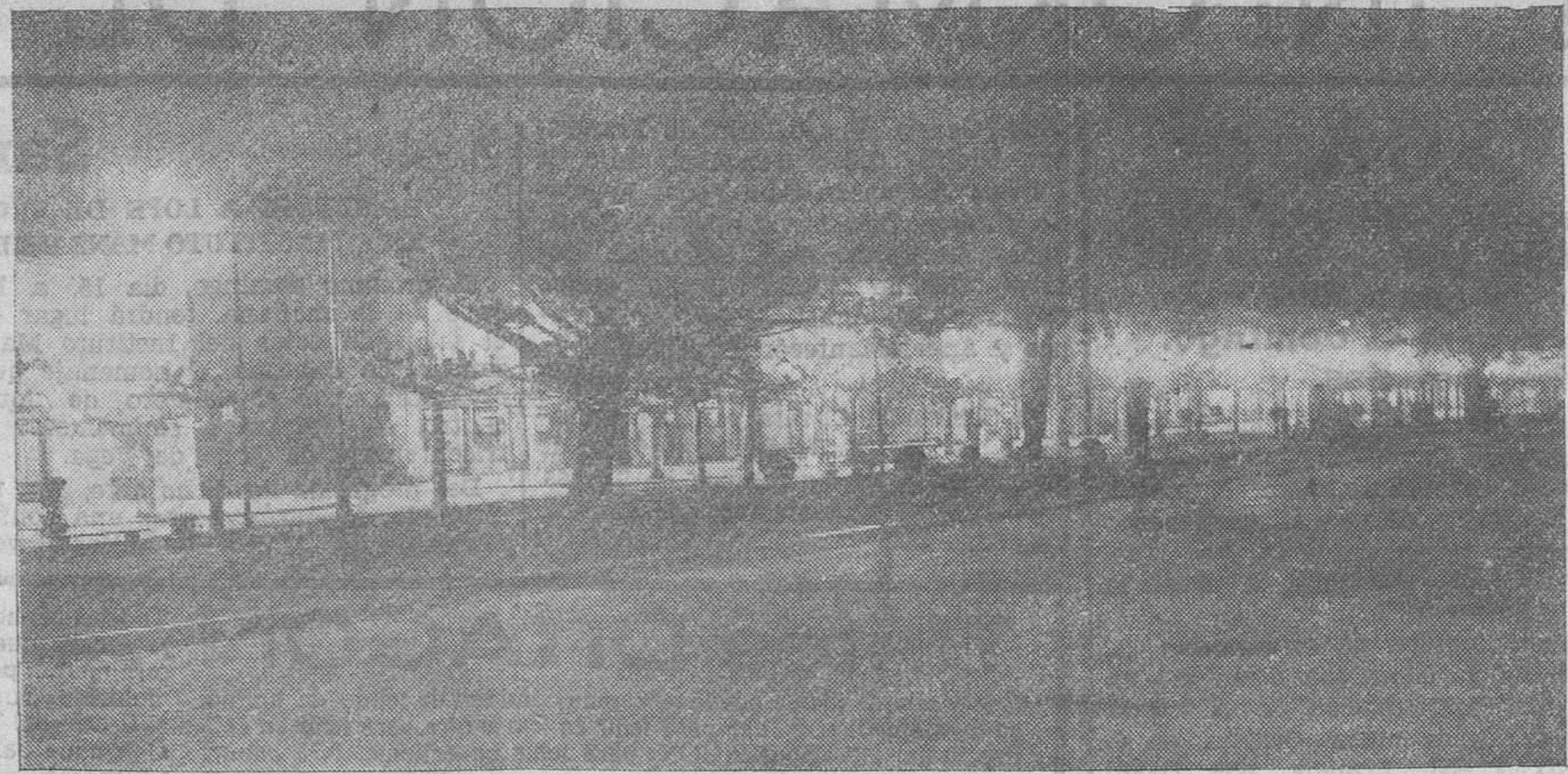
El paseo de Perea, en estas noches de invierno, frías y lluviosas, visto desde la zona marítima por la máquina de 'Samot'.

Un poco de marejadilla, viento fofo del sudoeste y cielo y horizontes muy brumosos.