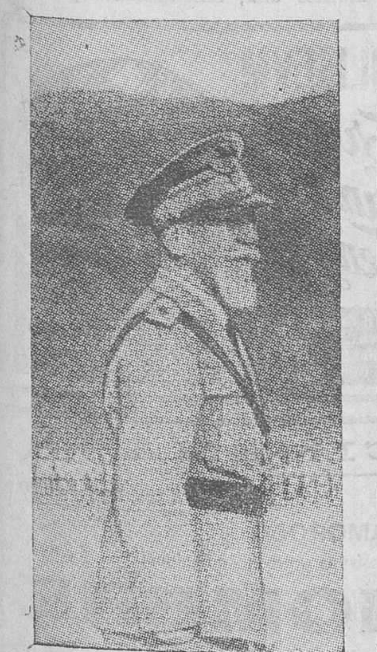
LA GUERRA EN ABISINIA. — El general De Bono, comandante en jefe de las fuerzas italianas que operan en Etiopía.