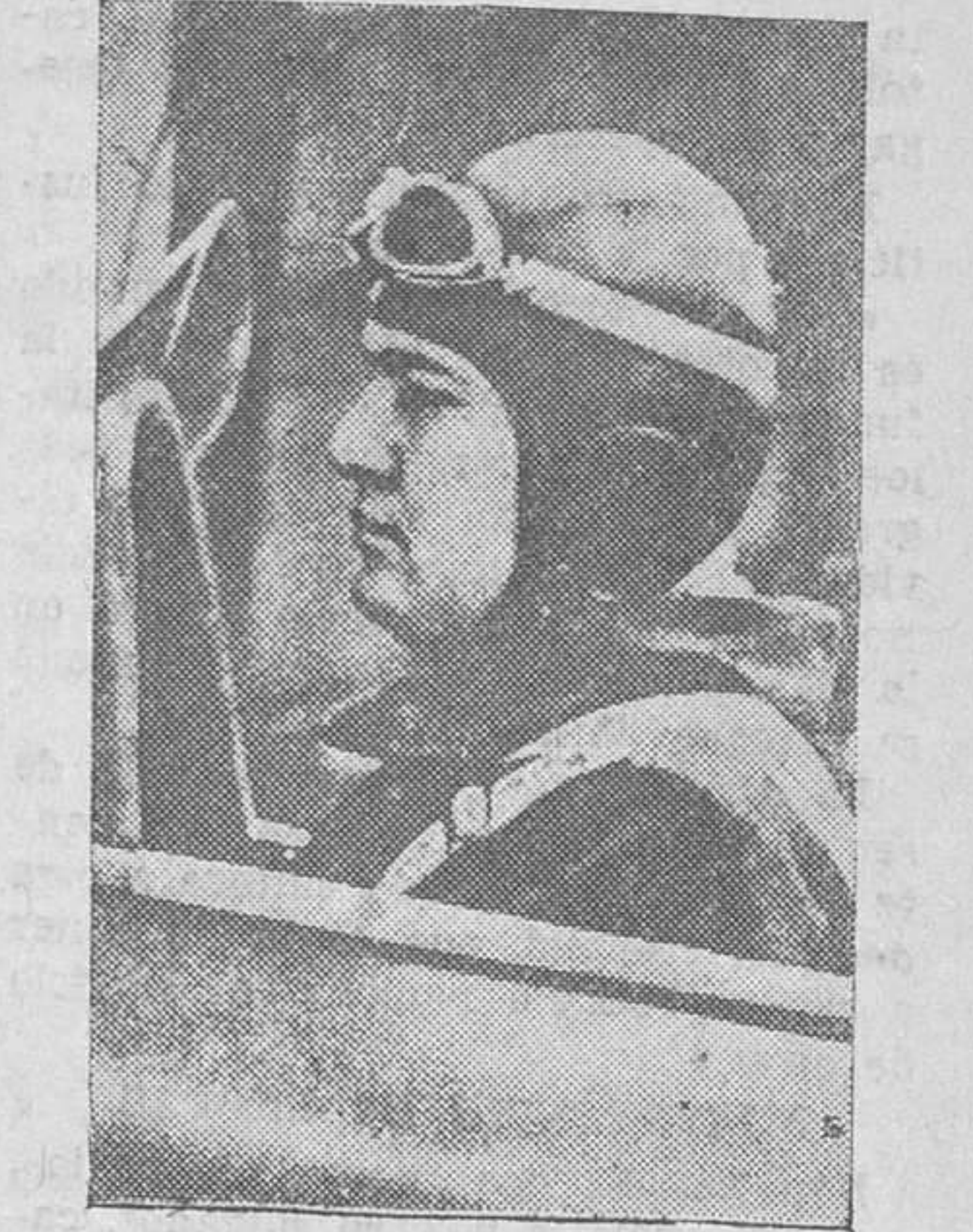
LA GUERRA EN ABISINIA. — Vittorio Mussolini, hijo del gran pontífice del fascismo italiano, que ha tomado parte en el bombardeo de Adua.

PARA MUEBLES ECONOMICOS Y MODERNOS RIBALAYGUA