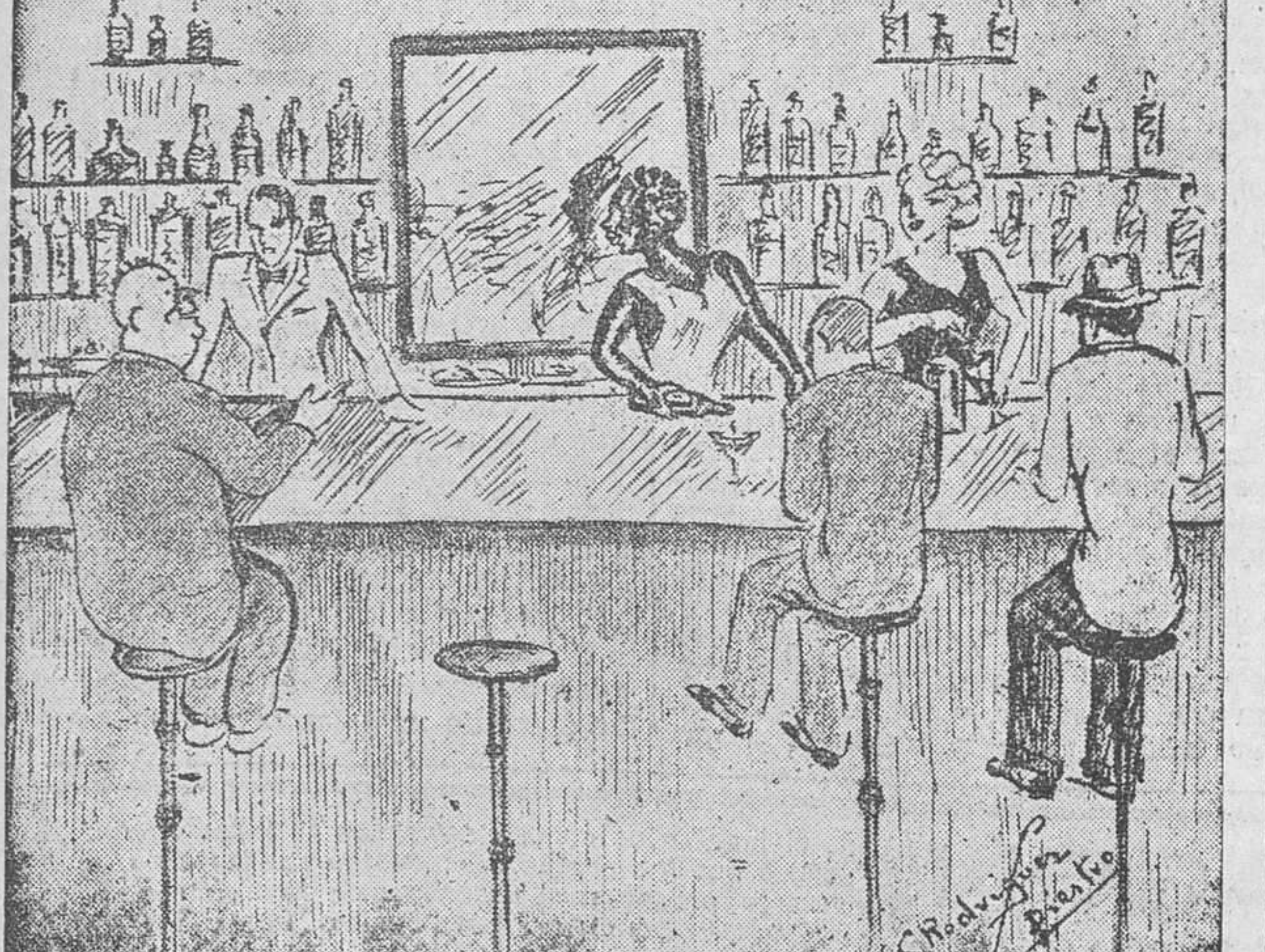
EL CLIENTE. — Un bock de cerveza. EL BARMAN. — ¿Cuál desea usted, ¿la negra o dorada? EL CLIENTE. — Sírvame las dos, que ambas me agradan.