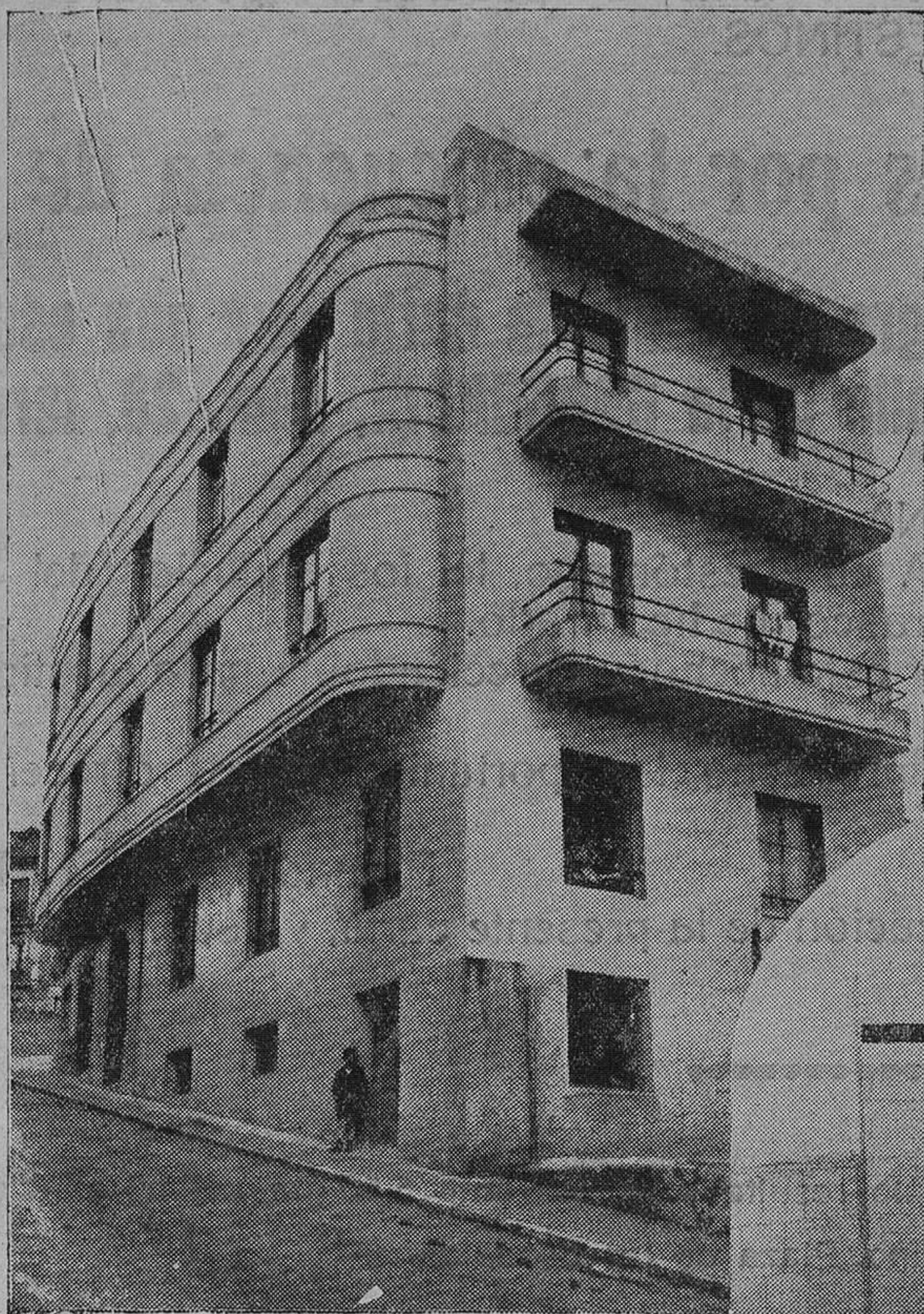
Edificio, propiedad, donde se halla instalado el obrador de MANTECADAS «REGENTES», y vista general del horno donde se efectúa la cochura de MANTECADAS «REGENTES».

Cuesta de la Atalaya, 34. - Teléfono 18-57. - Santander.