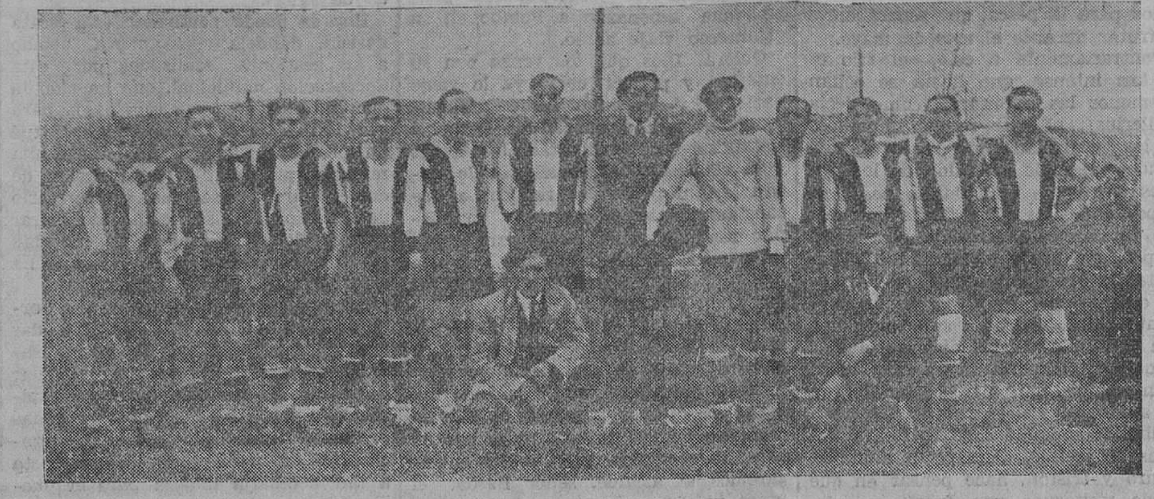
LA UNION MONTAÑESA, DE ESCOBEDO, SUBCAMPEÓN SERIE A (PUEBLOS).

El partido octavo de final de la Copa de España comenzará hoy, a las cuatro y media, en el Stadium Metropolitan.