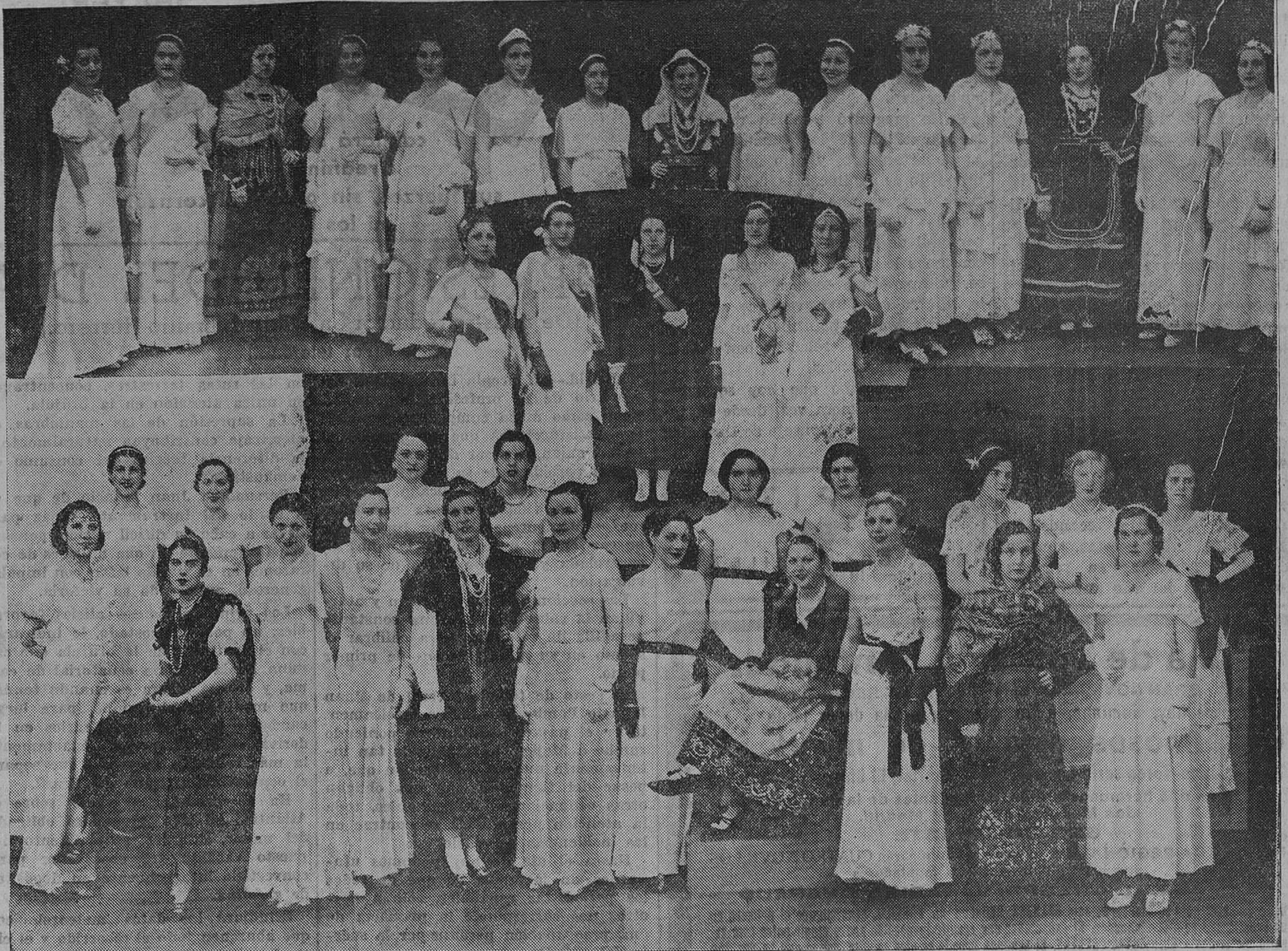
LAS CASAS REGIONALES. — Bellas señoritas que fueron elegidas por las Casas regionales como reinas y damas de honor de la fiesta celebrada ayer en el María Lisarda Colisevm.