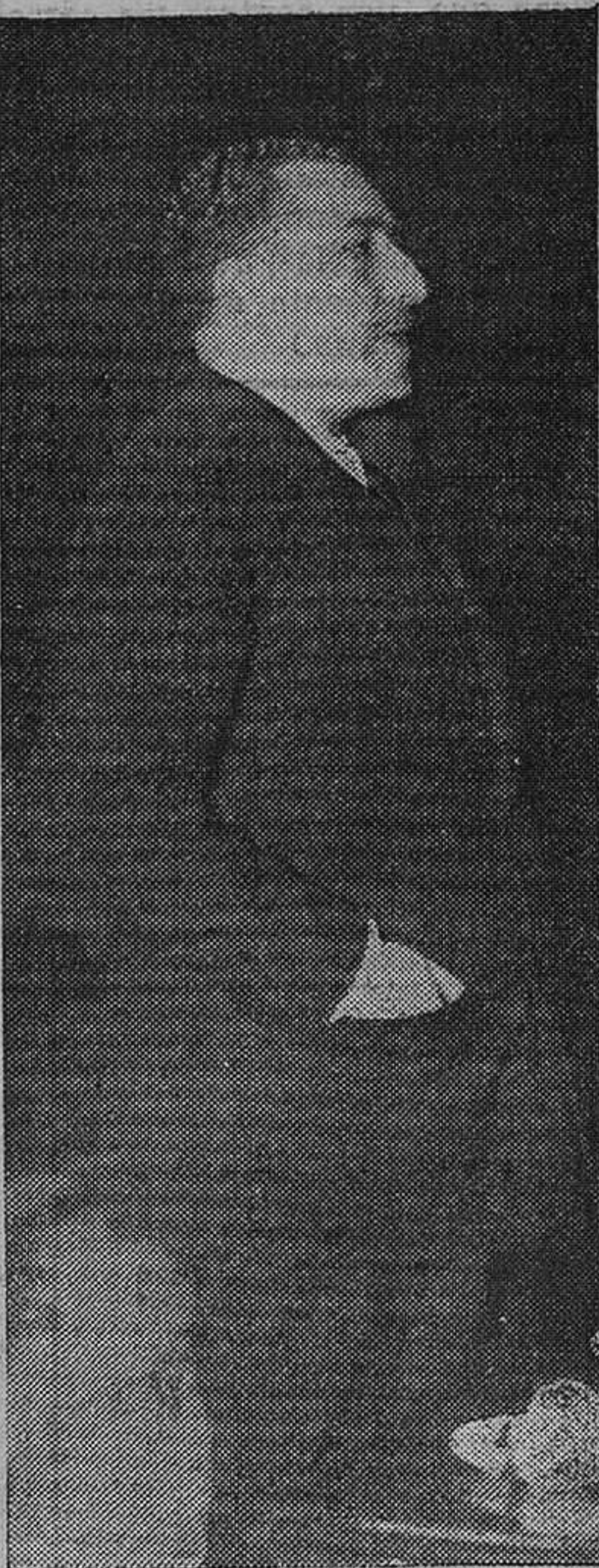
El jefe del Partido Nacional Republicano, don Felipe Sánchez Román, pronunciando su discurso.

Y cuando, enfrente, contemplaba a don Manuel Azaña, silencioso, me dije, con cálida admiración: he aquí un hombre que está llegando a las cimas