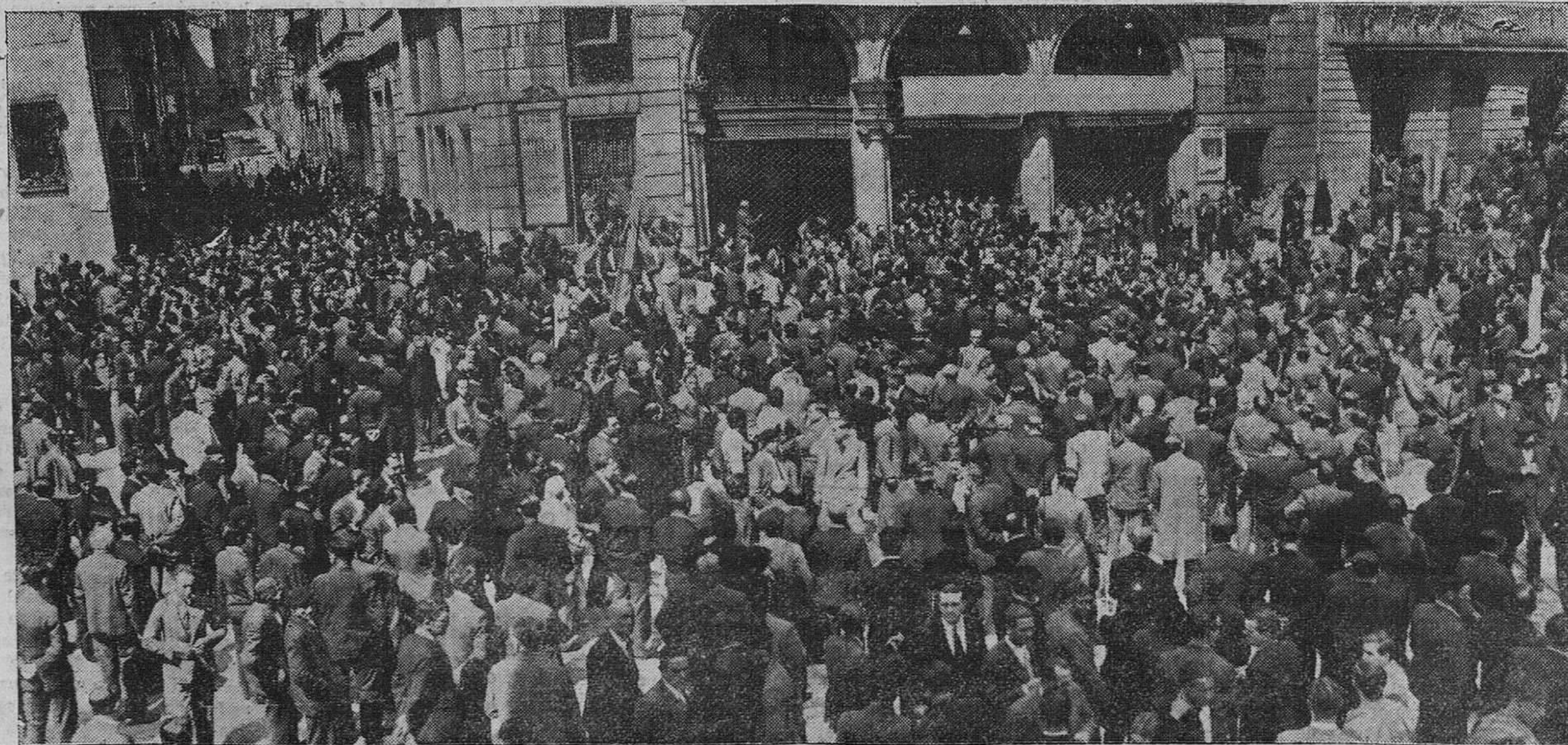
EL ACTO POLITICO DEL DOMINGO. — El público que no pudo entrar en el Teatro Pereda, escuchando los discursos desde las calles del Río de la Playa y de Marcelino S. de Sautuola.

No se trata de declarar una vez más nuestra posición política en abstracto; es decir, de reiterar ahora la doctrina y soluciones de nuestro programa a los problemas permanentes del Estado republicano. Vengo con un cometido más particular; a decir cuál es la posición que concretamente adopta el Partido Nacional Republicano en vista del actual momento político, bien entendido que en ningún caso las posiciones concretas que adopte el Partido Nacional Republicano ante los mo-