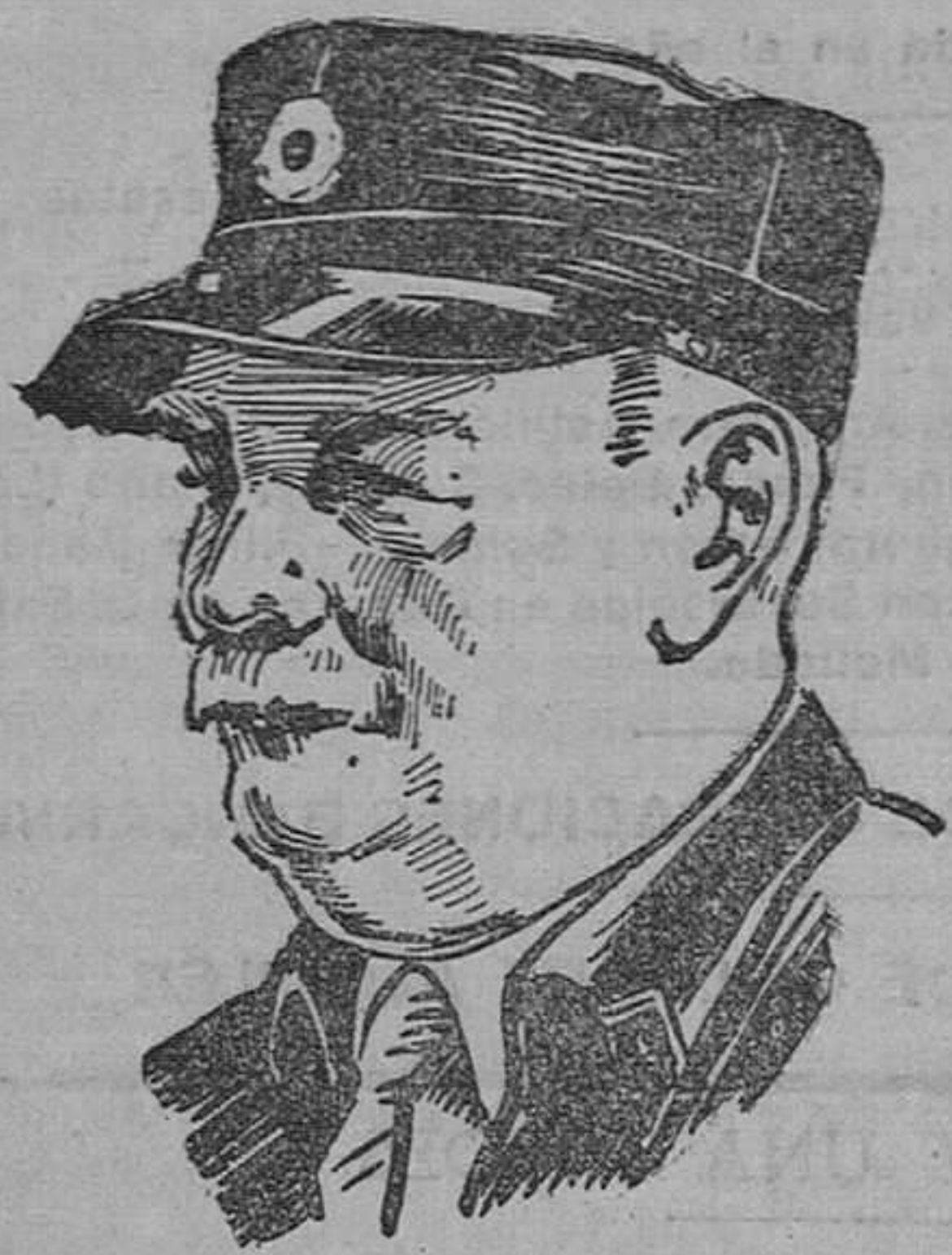
La maravillosa historia de un cartero

«Durante muchos años sufrí de los pies. Se me hincharon, me ardían y los tenía llenos de callos. Había momentos que me producían angustia insuperable. Un día, el doctor D. L., que observó mi padecer, me recomendó con gran insistencia e interés los Saltratos Rodell, los cuales adquirí aquella misma tarde. Tan pronto hube introducido los pies en aquel baño calmante y curativo, el dolor y la quemazón desaparecieron como por encanto. Al cabo de un rato pude arrancar de cuajo los callos que tenía, y desde entonces no he vuelto a sentir el más leve sufrimiento. Con el uso constante de los Saltratos Rodell tengo los pies en admirables condiciones, lo que me permite andar 25 kilómetros diarios sin la menor molestia. Los Saltratos Rodell se recomiendan y venden, a un precio módico, en todas las Farmacias, Droguerías, Perfumerías y Centros de Específicos.»