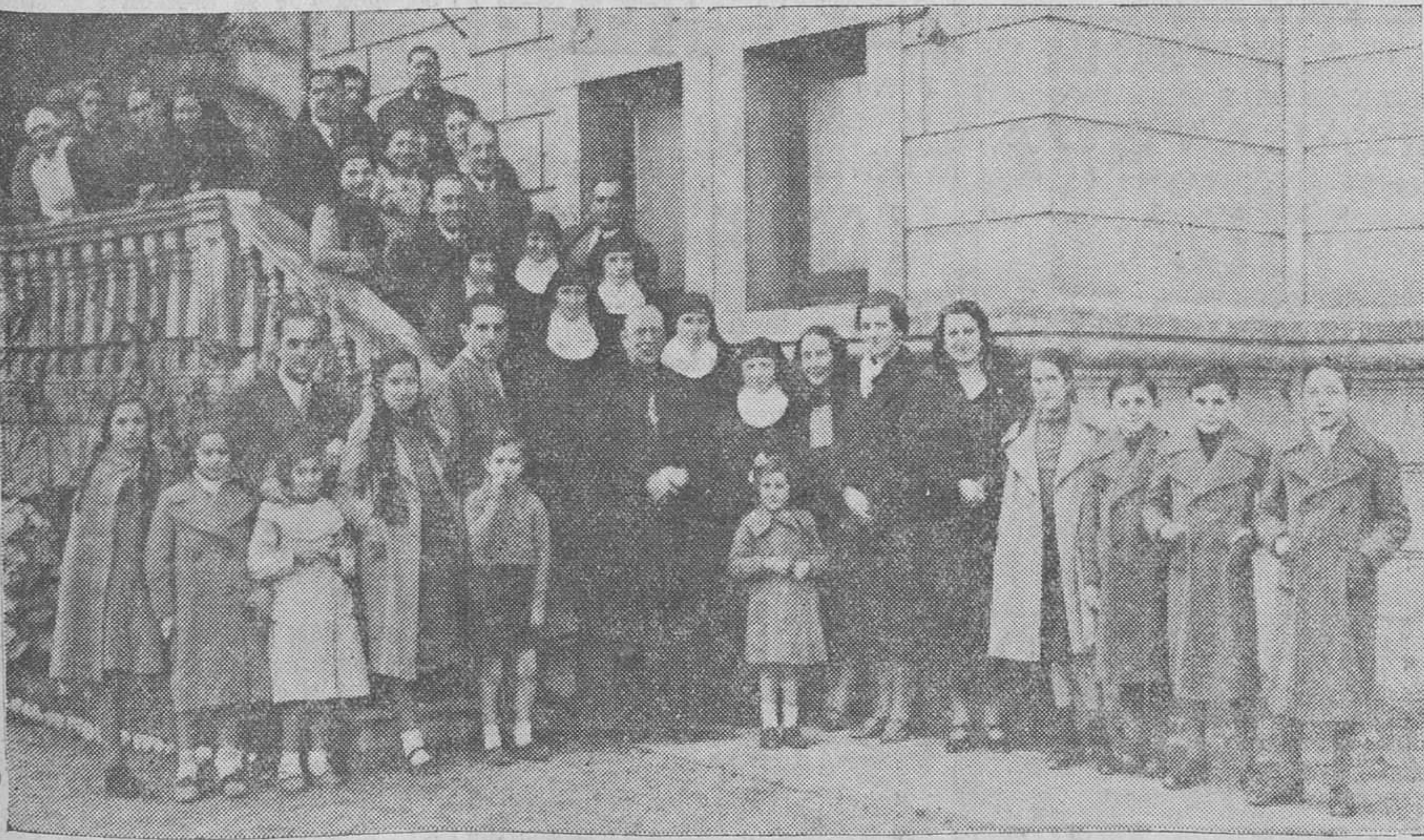
UNA FIESTA RELIGIOSA. — El obispo de la diócesis, con los médicos, Hermanas de la Caridad y algunos distinguidos invitados a la fiesta religiosa que se celebró el pasado domingo en el Sanatorio «La Alfonso».