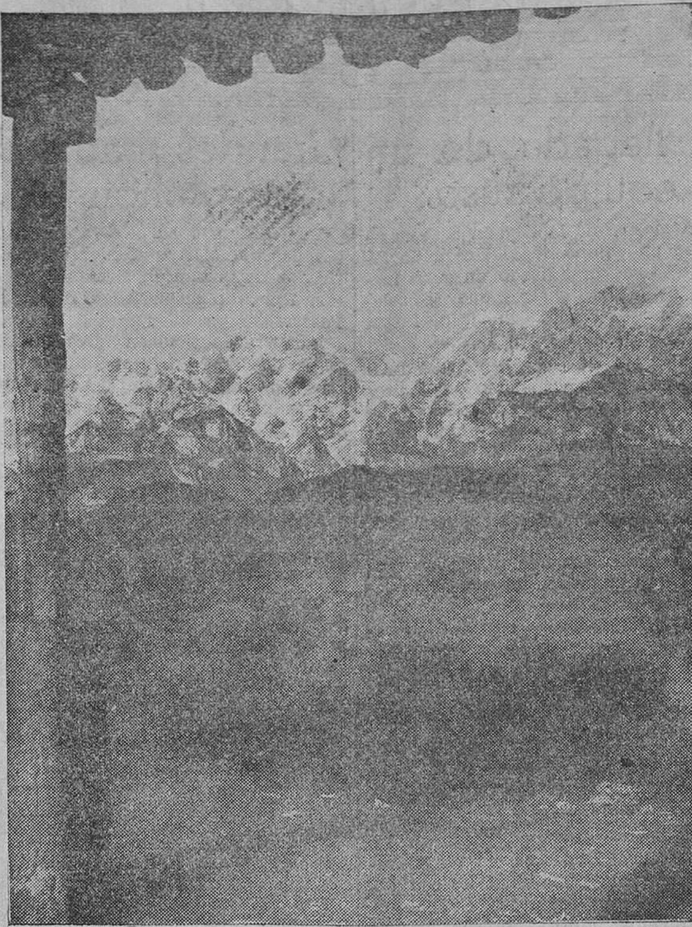
LOS PICOS DE EUROPA