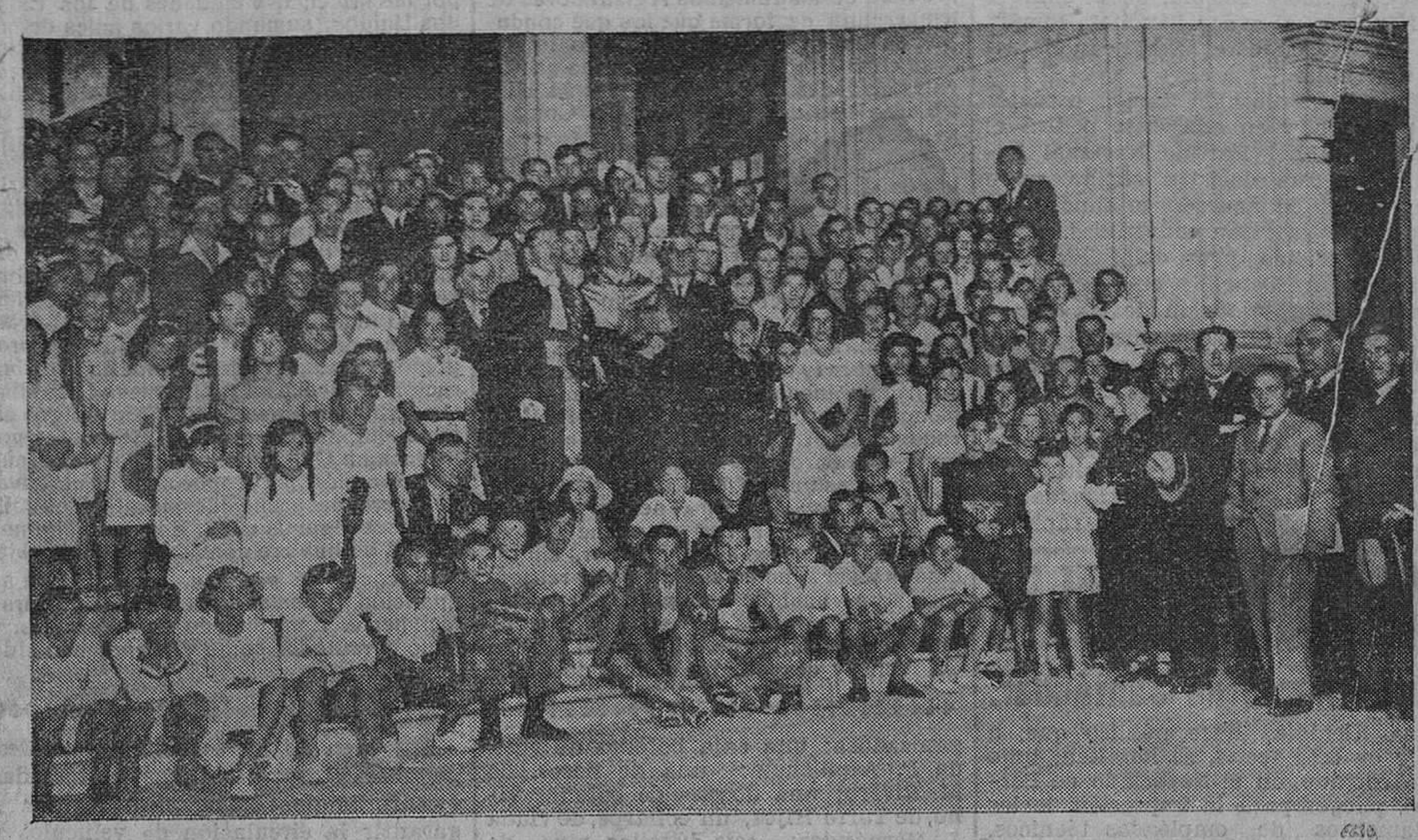
Reparto de premios a los alumnos de la Asociación Hispano-Francesa. Autoridades y asistentes al acto.