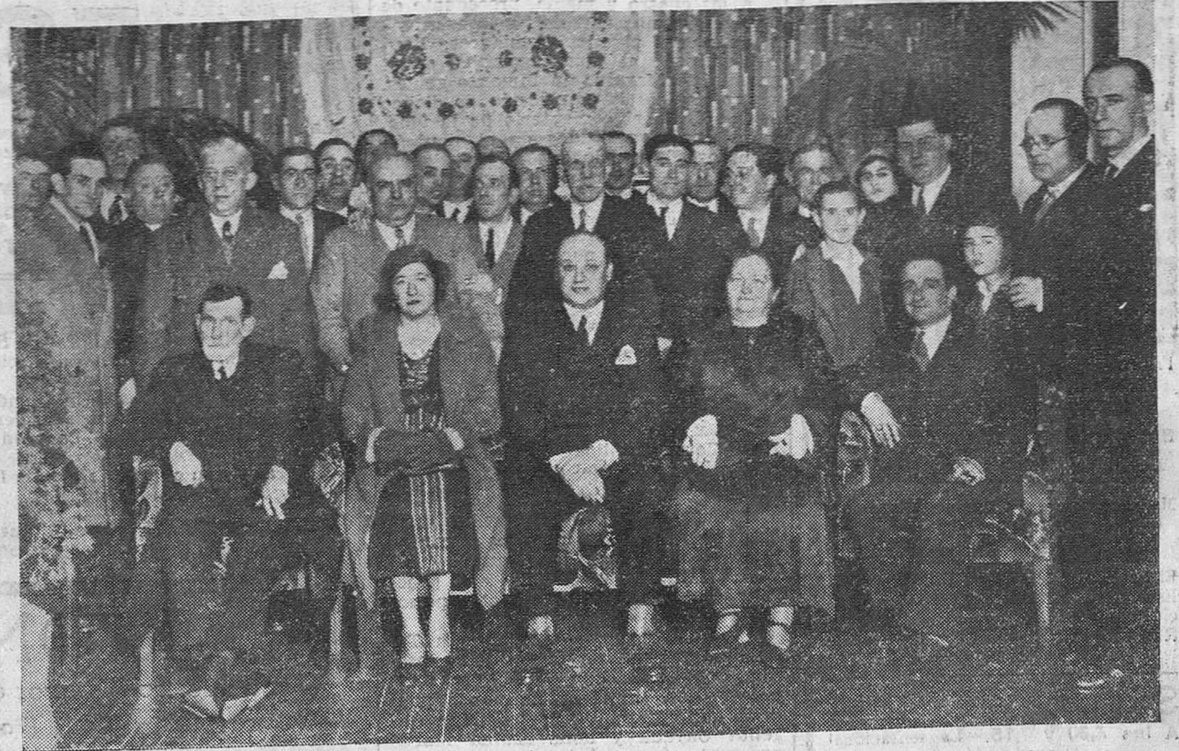
INAUGURACION DE LA CASA DE ANDALUCIA. — Las autoridades y varios invitados al acto inaugural, celebrado ayer, con gran esplendor.

Los forros para frenos que no llevan la palabra FERODO no son frenos FERODO.