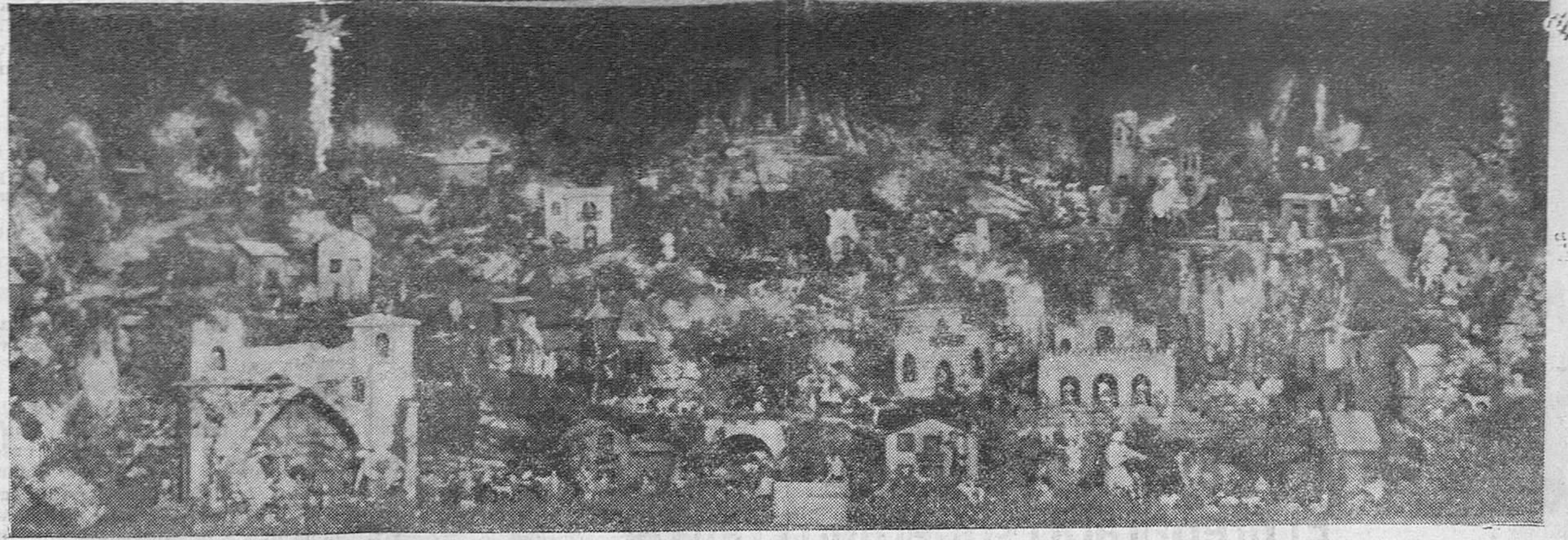
UN NOTABLE NACIMIENTO. — El precioso Nacimiento del Año de La Candelaria, que estará expuesto al público hasta el próximo domingo, día 14, con objeto de allegar fondos para sufragar los gastos de las comidas extraordinarias a los pobres.

Es lástima que las cosas no ocurran al revés, o sea, que es de lamentar que ese espíritu de solidaridad republicana no sea permanente, en constante obra de colaboración, como muralla inquebrantable republicana frente a la labor constante de los detractores de la República, con cuya actitud se la serviría más eficazmente, así como también se daría un magnífico ejemplo al espíritu liberal y democrático del pueblo.