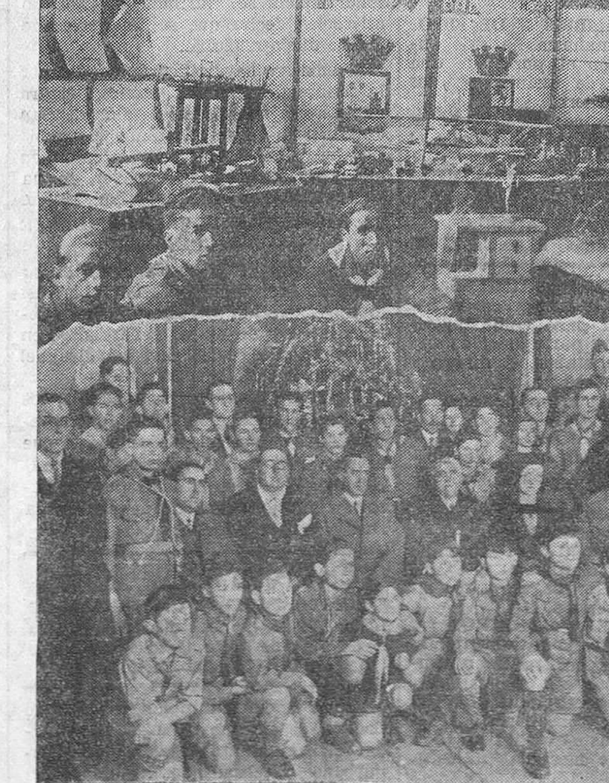
LOS EXPLORADORES. — Ayer se inauguró, en las escuelas de Numancia, la exposición de trabajos realizados por los exploradores montañeses. Presentamos aquí un rincón de la exposición, y un retrato de las autoridades, acompañadas de la pequeña tropa de «boy-scouts».

Una nota que pone de manifiesto el gusto y fina sensibilidad de estos «boy scouts» ha sido la idea de levantar un vistoso árbol de Noel, que ha