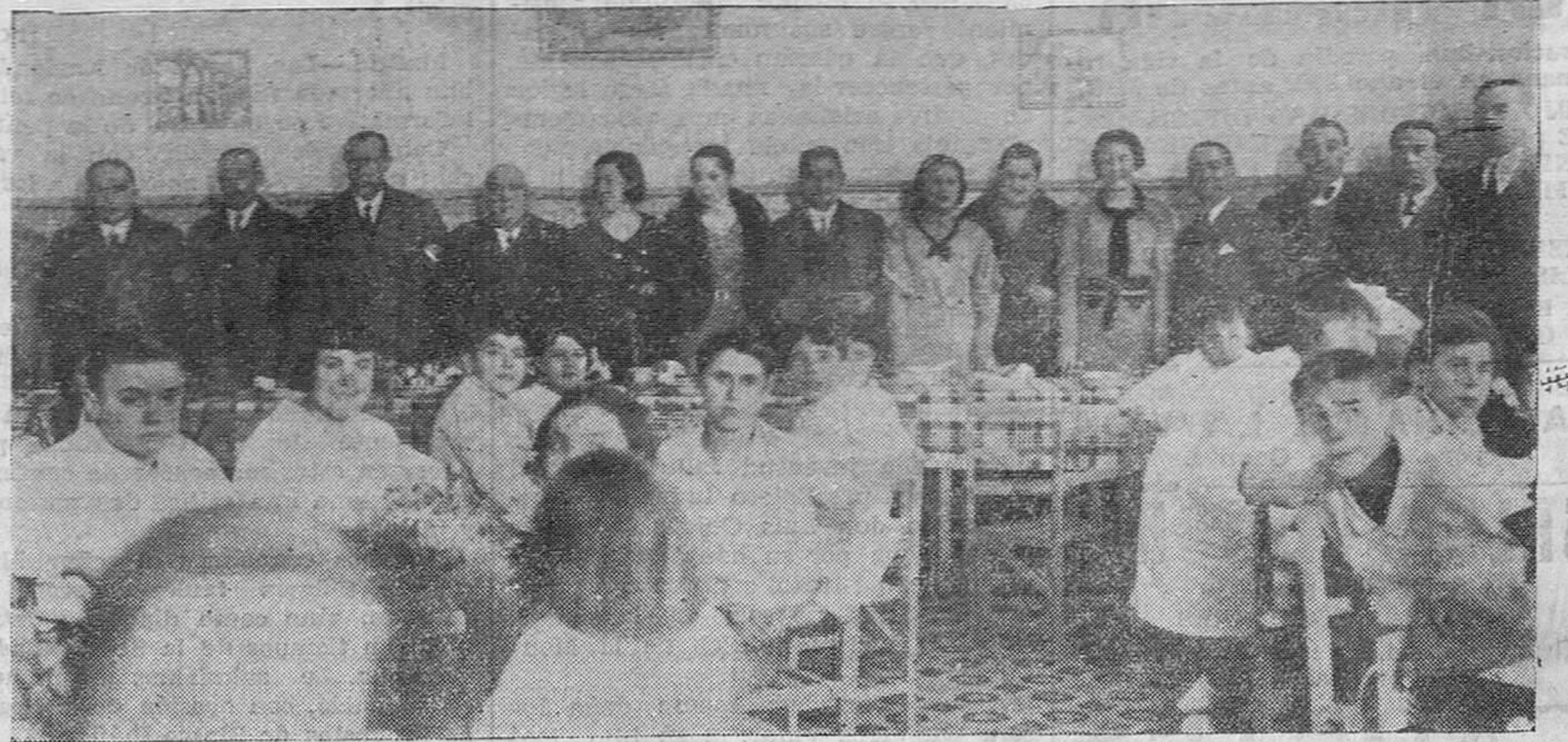
NAVIDAD EN LA ESCUELA. — Un detalle del simpático acto celebrado el domingo en el grupo Ramón Relayo, por los padres de familia.

Si por motivo de una lluvia torrencial se producen grandes inundaciones o corrimientos de tierra que obstruyen las carreteras, se procede en seguida, por el Estado, al natural y consiguiente arreglo, con toda celeridad, y en cambio, si la interceptación del tráfico es originada por una gran nevada es necesario tener resignación y paciencia, en espera de que la nieve se quite con el Sol o el Sur. Es preciso terminar con esa insensibilidad administrativa, que tanto perjudica a regiones como la de Campoo, que se encuentra con sus carreteras interceptadas desde hace días al tráfico, a causa de una gran nevada. Conviene prever para lo sucesivo el medio de habilitar que haya siempre una consignación con destino al menester citado, para lo cual los representantes de los distintos pueblos que sufren con frecuencia la plaga de la nieve, deben dirigirse con dicha petición a quienes están encargados, por la voluntad del pueblo, de la defensa de los intereses de la Montaña. No hacer esto es volver a dejar indefensos para lo sucesivo los intereses de los campesinos y de la vida comercial del país en donde nieva, y querer que se repita eternamente eso de los telegramas de las fuerzas vivas al gobernador, el oficio correspondiente del gobernador a Obras públicas y la desoladora contestación de que no hay dinero y que se ha ordenado a los peones camineros que empleen el espaleo.