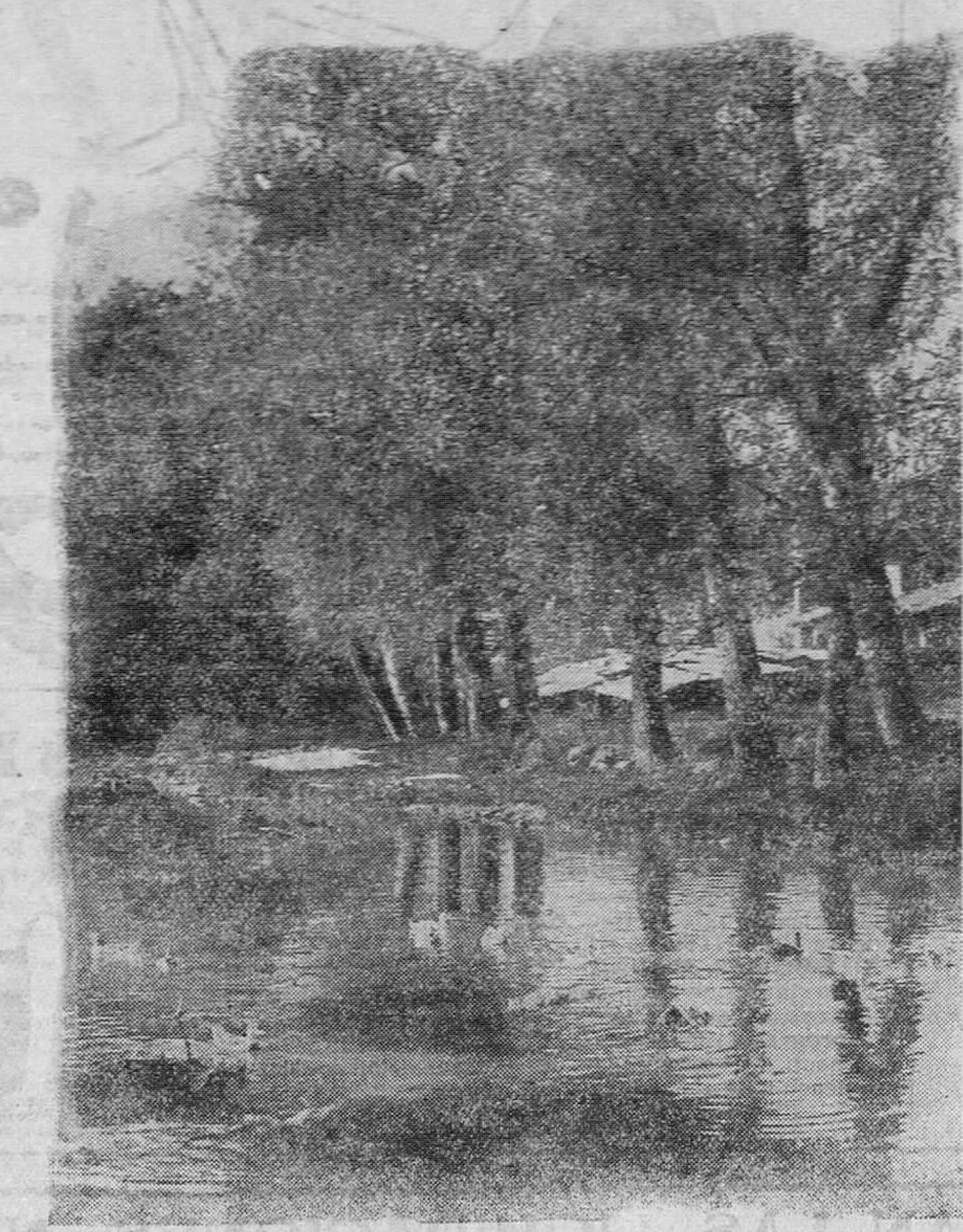
PAISAJES MONTAÑESES. — La Barcenilla, en Reinosa.

La Comisión hizo suya una petición de la Comisión permanente de las Federaciones profesionales para que la Oficina internacional del Trabajo emprenda una encuesta sobre las paten-