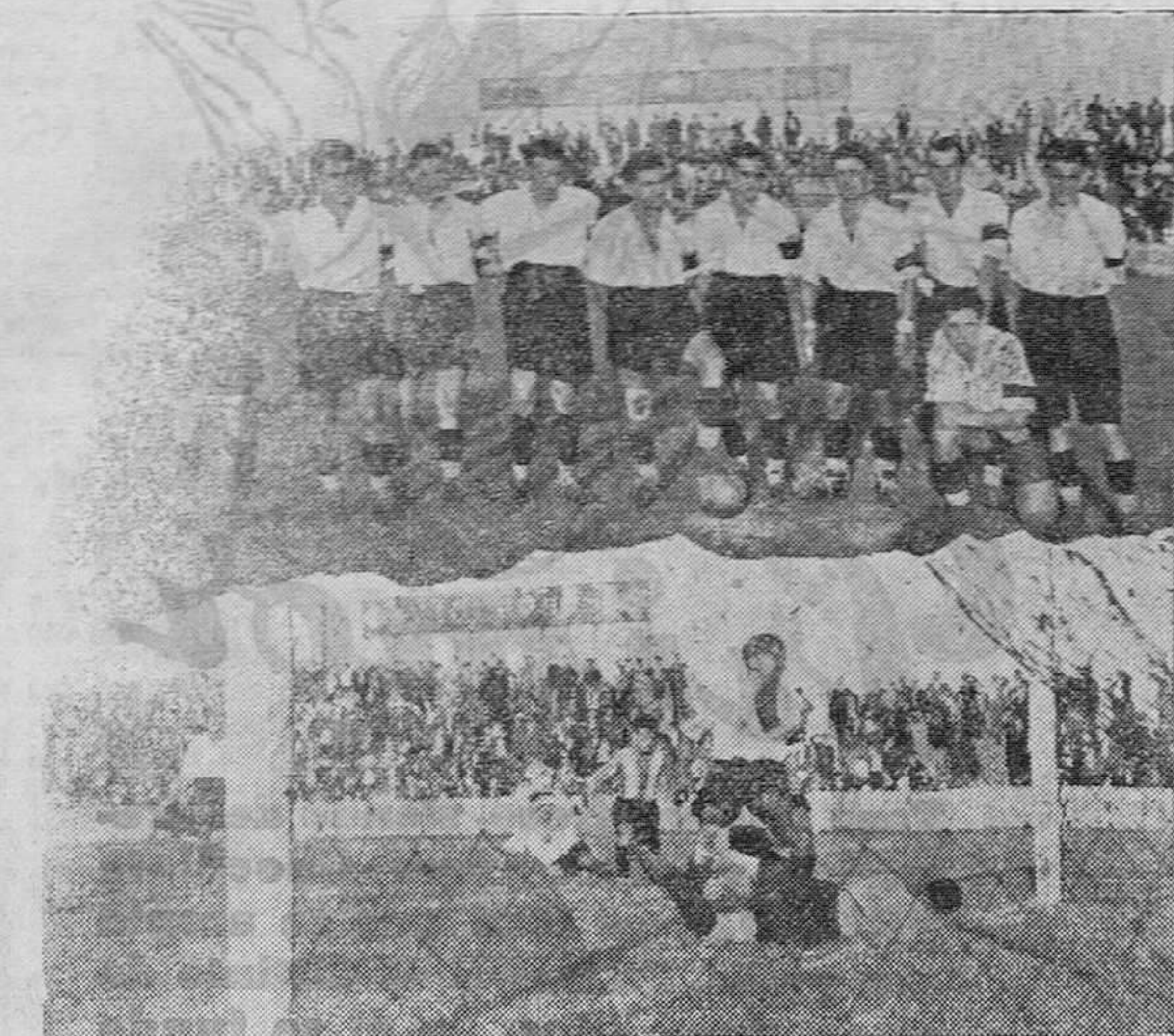
El equipo Deportivo Naval, de Reñosa, que, aun cuando perdió frente al Racing, destacó por la nobleza de su juego y por la corrección de sus equipos. — Uno de los tantos racinguistas.

El Racing obtiene fácilmente un triunfo sobre el Deportivo Naval. Y el Deportivo Torrelavega vence al Santoña por dos a cero.