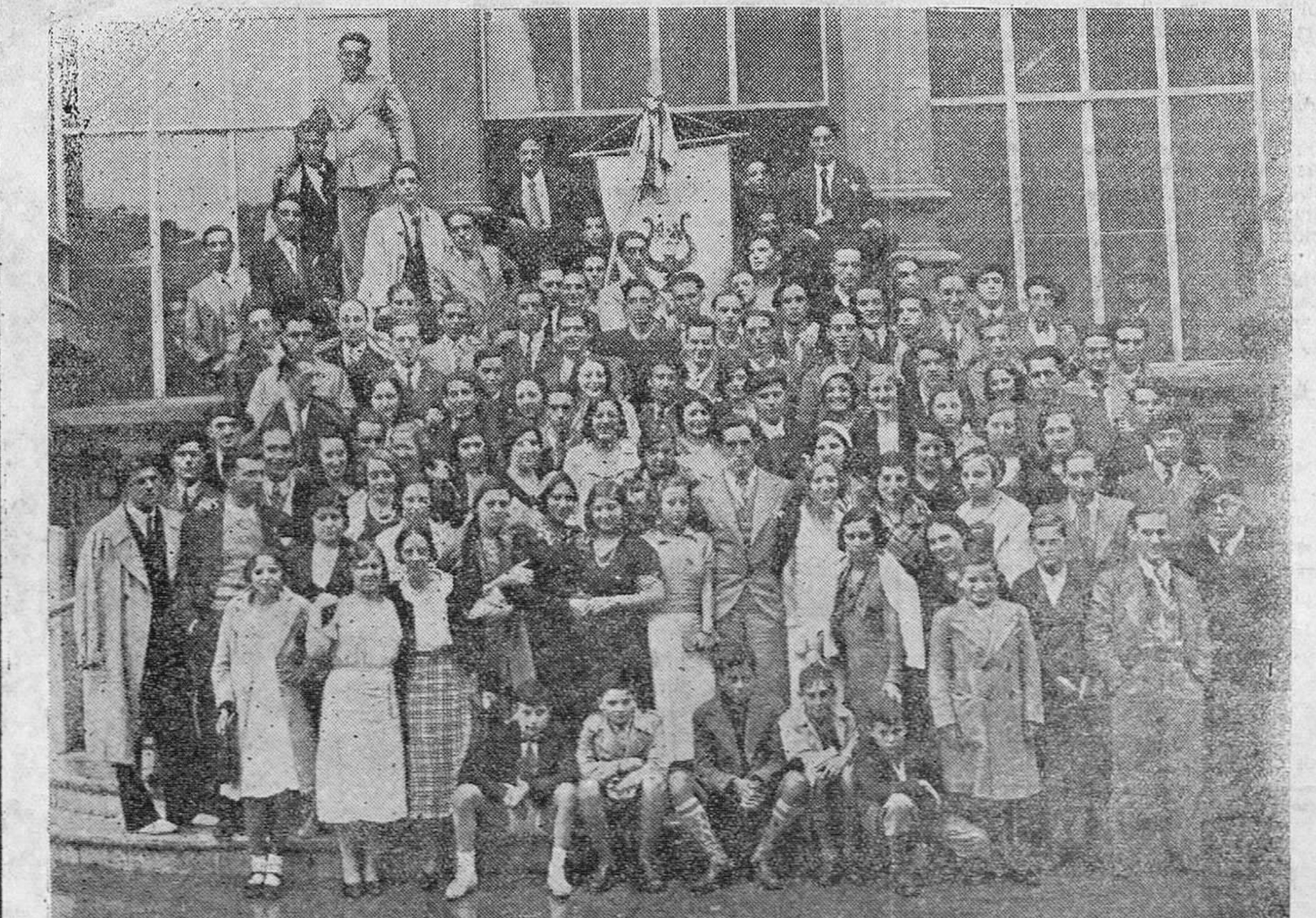
El notable Orfeón de Castro Urdiales, vencedor en el concurso de orfeones, celebrado en Oviedo, con motivo de las fiestas de San Mateo.

ROYALTY GRAN HOTEL.—CAFÉ.—RESTAURANT JULIAN GUTIERREZ Casa especializada en BODAS, BANQUETES, LUNCHS y TES, con servicio moderno del más refinado gusto. RESTAURANT RENOMBRADO Plato del día: Mollejas bresseadas Bouquetier.