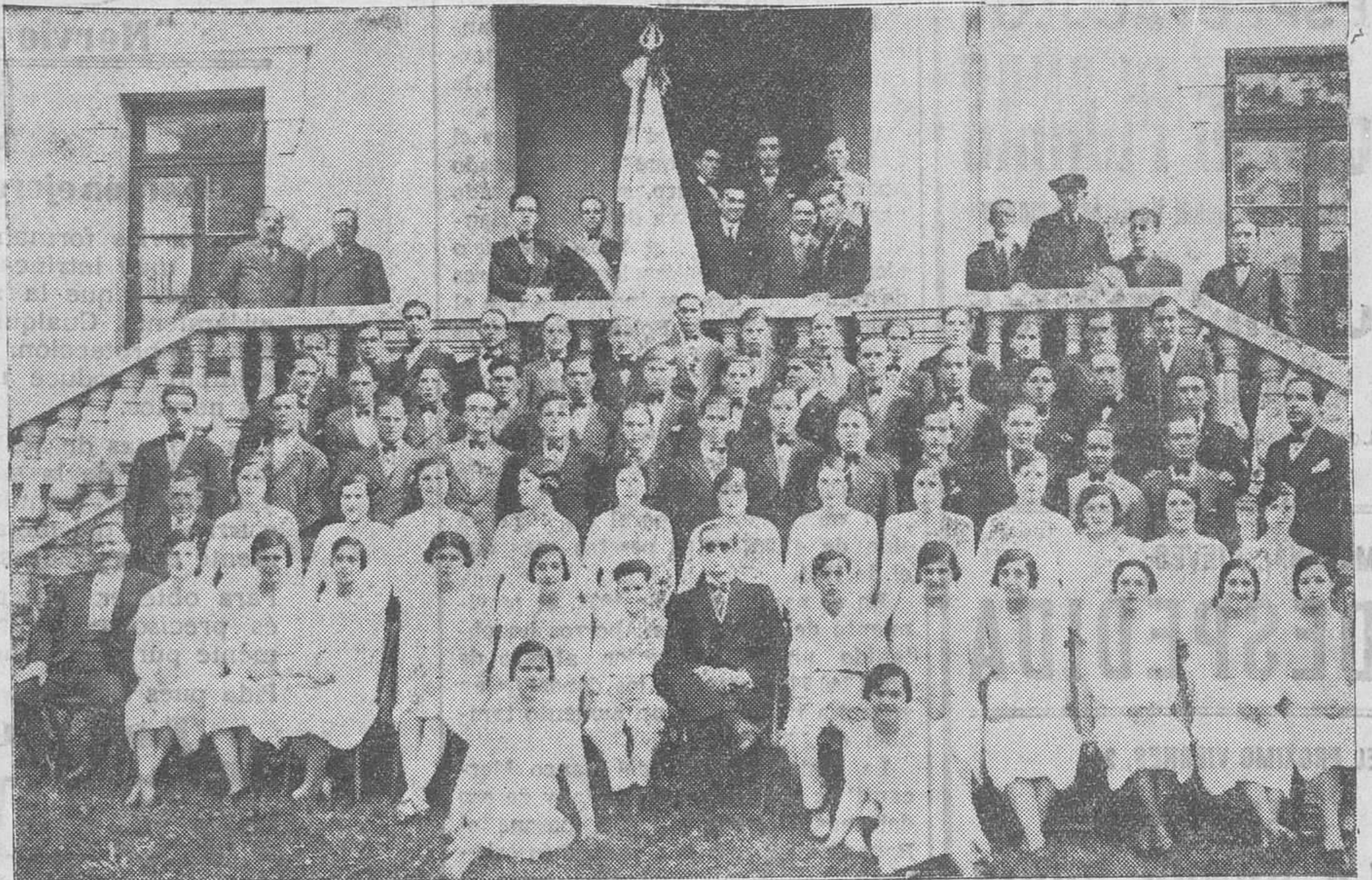
EL ORFEON DE ASTILLERO-GUARIZO. — La aplaudida masa coral de Astillero, una de las más notables de la provincia.

Interesantísimos serán todos los asuntos que discutan los señores congresistas. Los esfuerzos educativos realizados por los maestros en conferencias y en artículos periodísticos; la posición ideológica de la Federación Internacional frente al problema de la paz, del desarme y de la cooperación intelectual; las amenazas permanentes de guerra; las medidas preventivas, de arbitraje, de seguridad y de desarme; la opinión sobre la definición de «agresor»; el boicot económico; la institución de un ejército internacional; el conflicto de conciencia que plantea el posible antagonismo entre el deber nacional y el deber internacional, y la