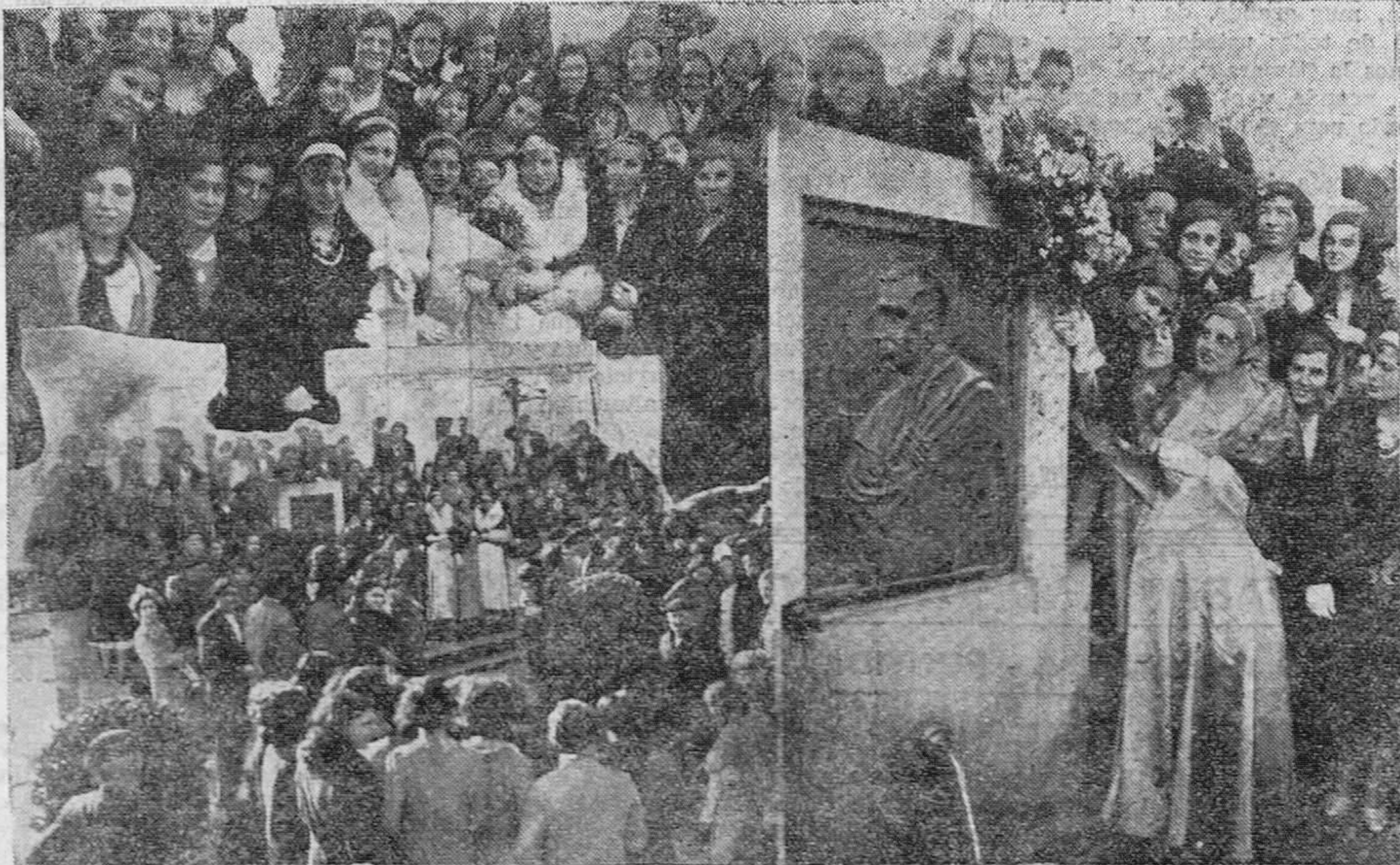
DE LA FIESTA DE LAS MODISTAS. — La «Señorita Santander», ante el monumento a José Estrañá, rodeada de representantes de las clases populares. — Momento en que la «Señorita Santander» colorea de flores junto al busto del inmortal «pacostillero».

JESUS MATA LASTRA Partos y Enfermedades de la Mujer DE TRES Y MEDIA A CINCO Y MEDIA Martillo, 4, 2.º - Tel. 2419