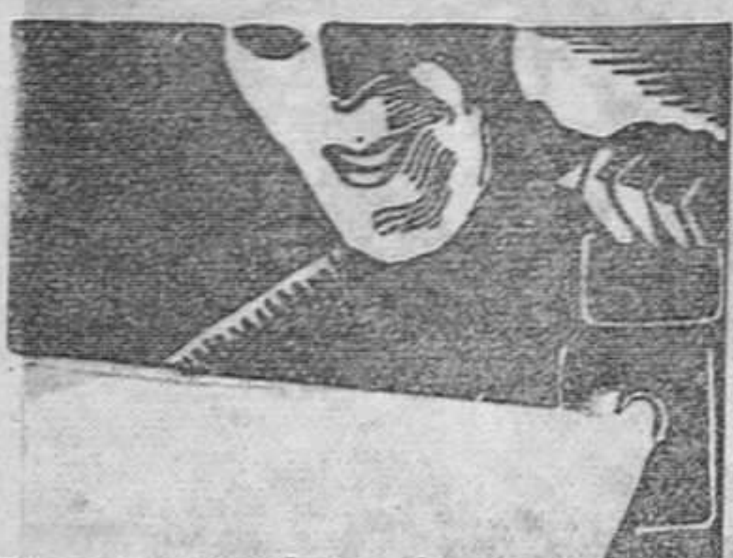
El protagonista de EL FAVORITO DE LA GUARDIA, en