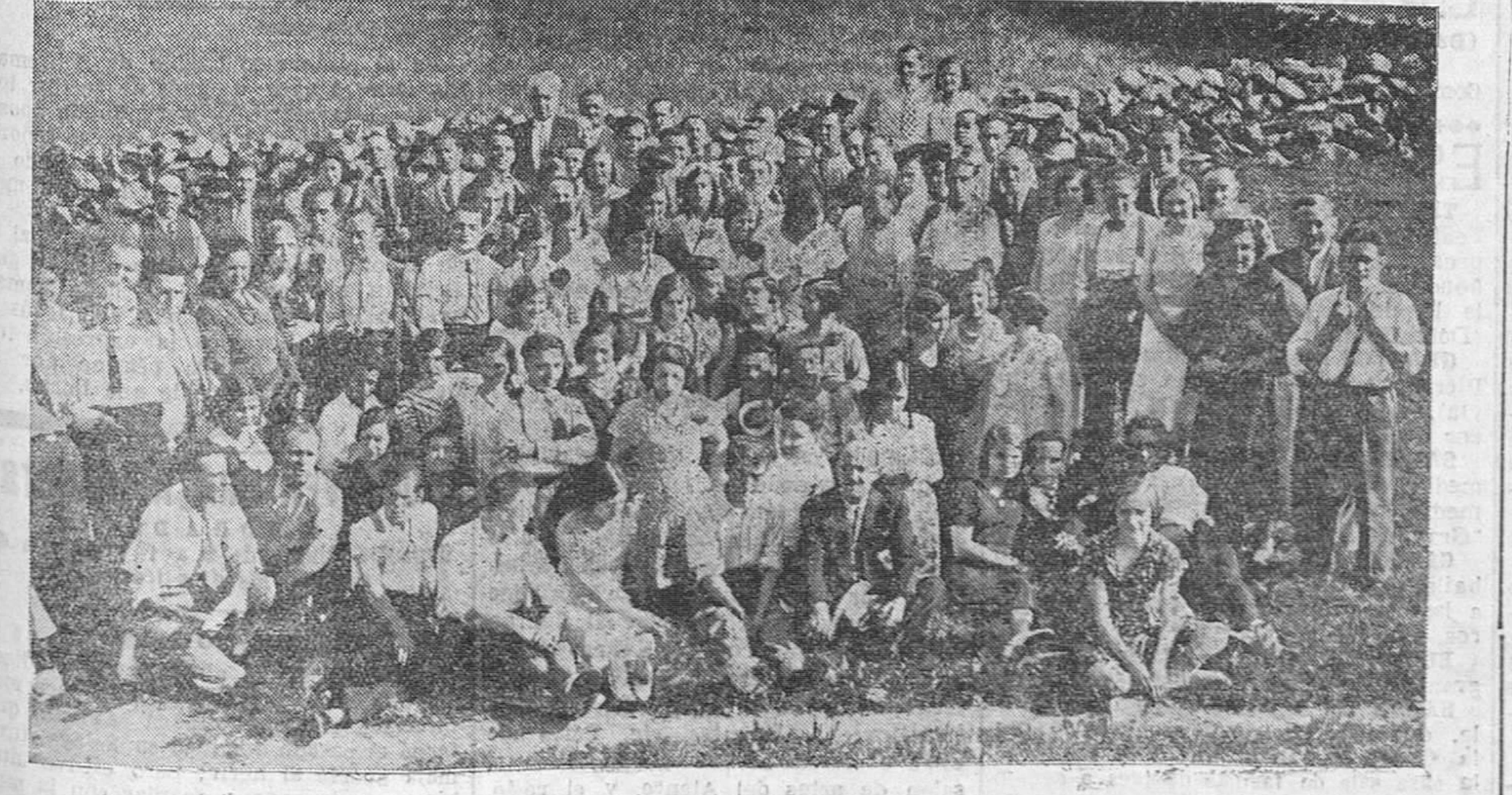
UN BANQUETE SIMPATICO. — Al terminar sus exhibiciones la Feria de Muestras, los propietarios de los distintos stands de la exposición han querido obsequiar a sus dependientes con un banquete en la Albericid, y este banquete se celebró ayer, con enorme animación, quedando todos los obsequiados satisfechos y agradecidos de los expositores, que han sabido acordarse de los que les ayudaron a triunfar en la Feria de Muestras, con un acto tan simpático y rumboso.