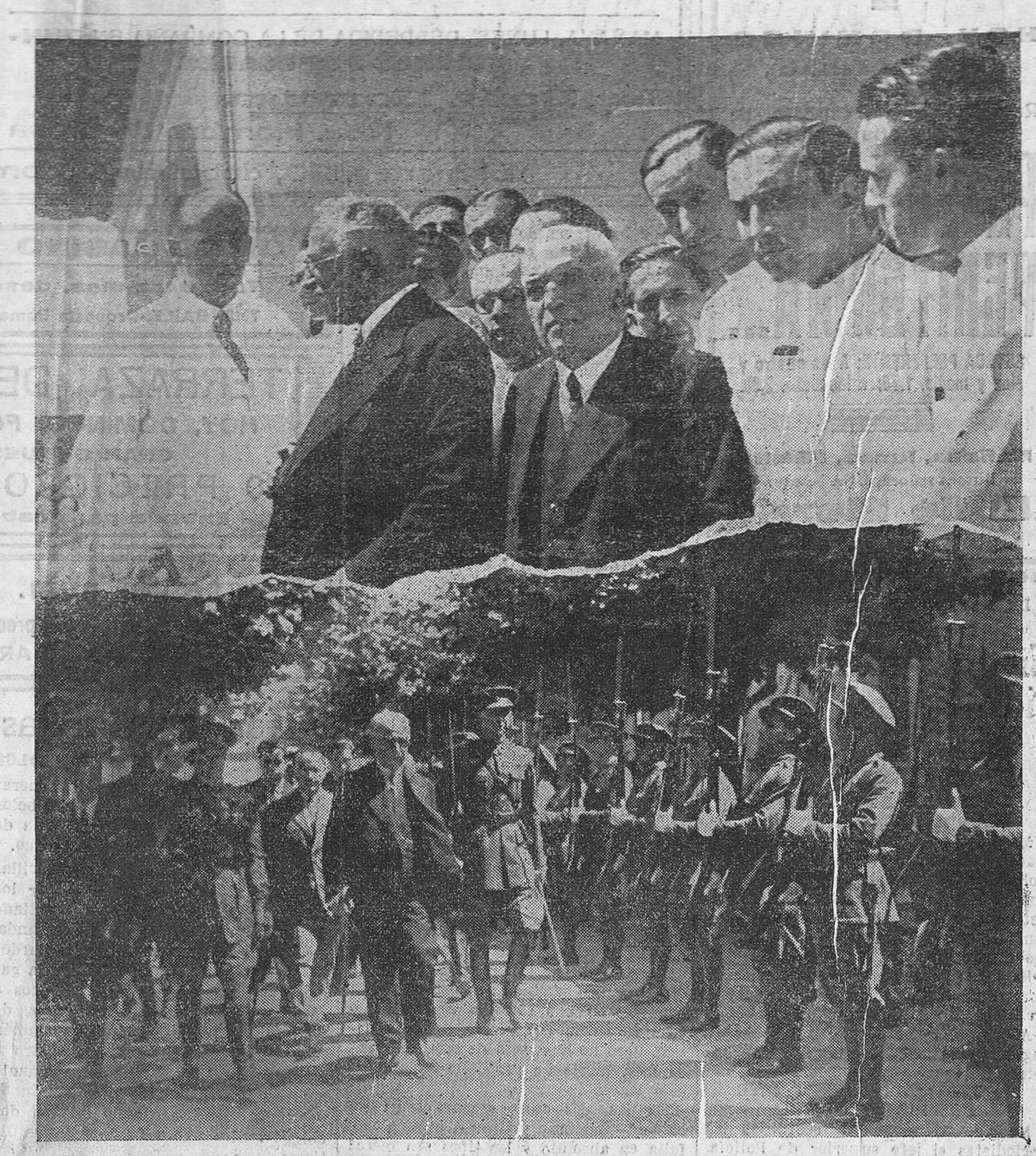
DOS VISITAS INTERESANTES. — El jefe del Estado y el doctor Díaz-Ganeja, conversando en una galería de la Casa de Salud Valdecilla, durante su visita a este magnífico centro benéfico. — El presidente de la República, revisando las tropas, a su llegada al cuartel donde se aloja el regimiento número 23 de línea.