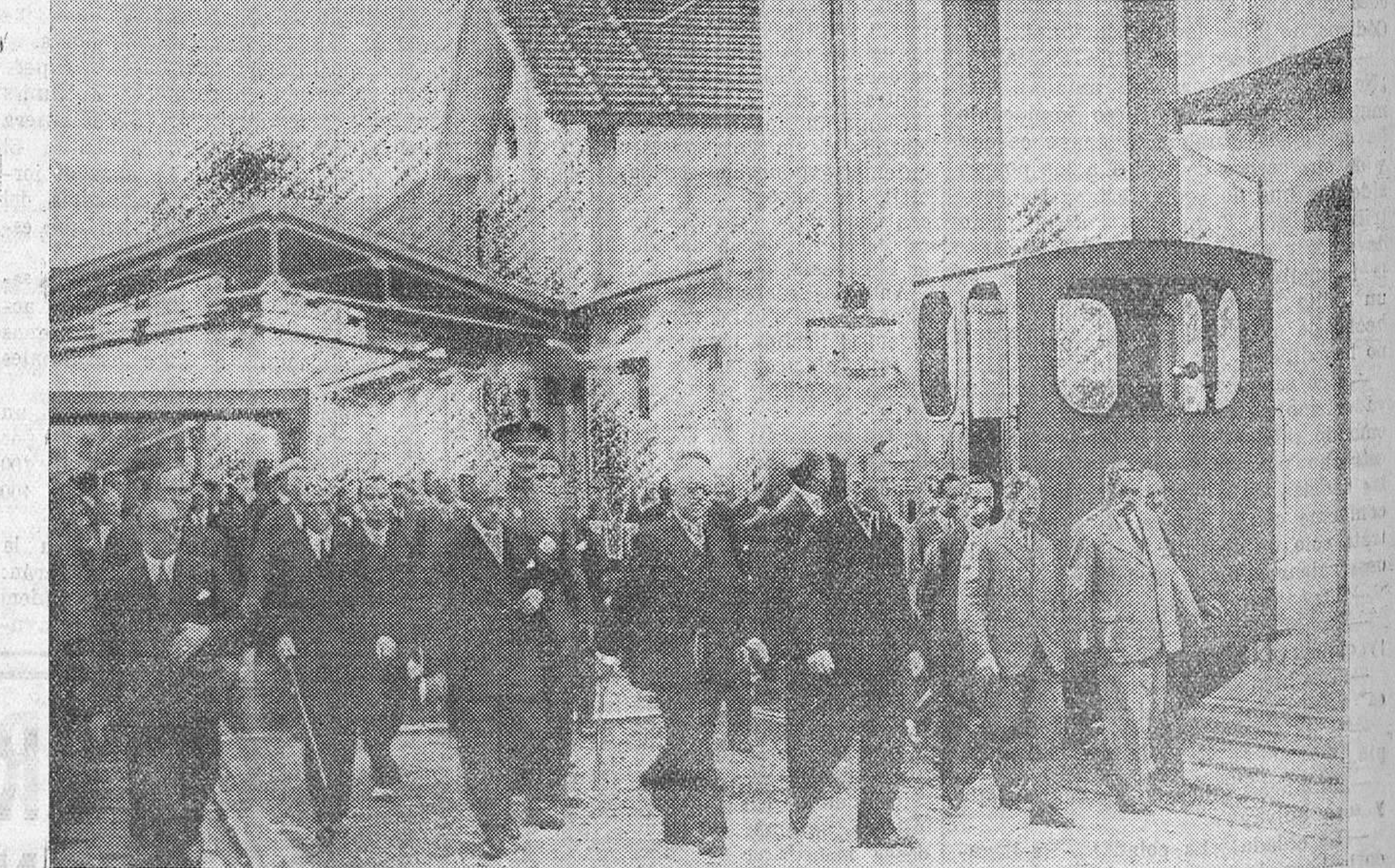
El ilustre presidente de la república y el ministro de Marina, en unión de los señores Torres y Pfersich, recorren las distintas dependencias de las importantes fábricas de La Penilla.

Luego, acompañado de los referidos señores, el presi-