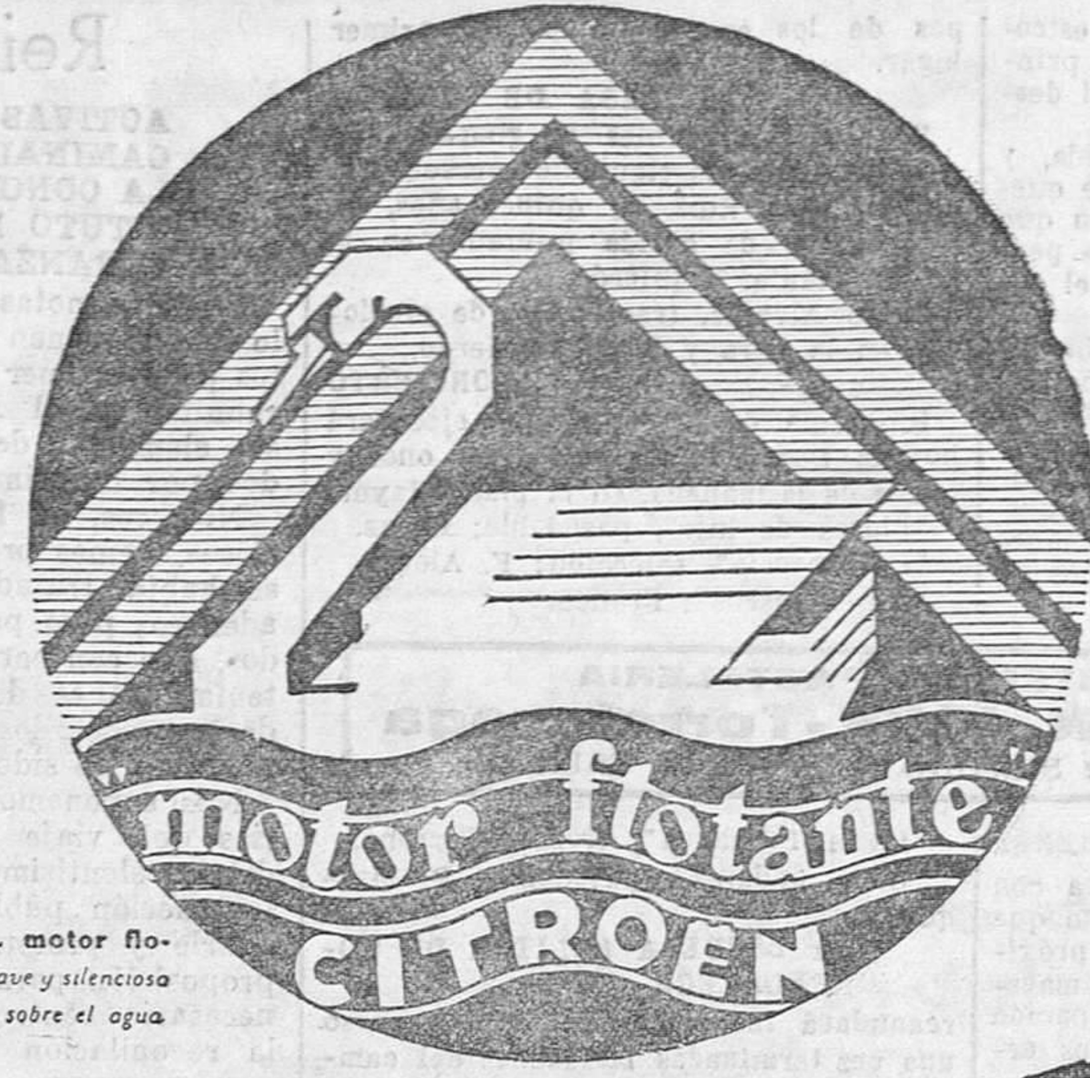
SÍMBOLO DEL motor flotante: Marcha suave y silenciosa como la del cisne sobre el agua