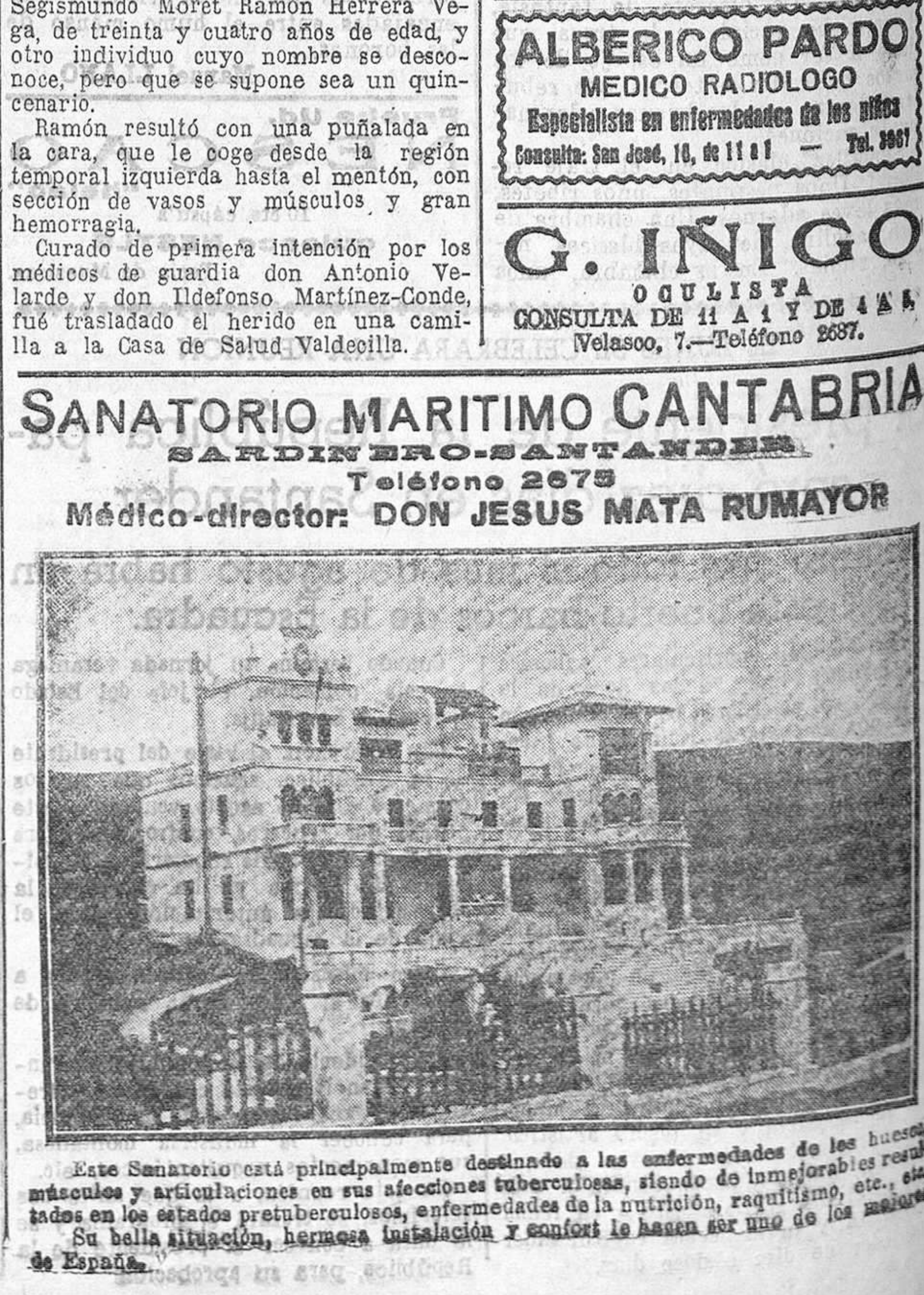
Este Sanatorio está principalmente destinado a las enfermedades de los huesos, músculos y articulaciones en sus afecciones tuberculosas, siendo de inmejorables resultados en los estados pretuberculosos, enfermedades de la nutrición, raquitismo, etc. Su bella situación, hermosa instalación y confort le hacen ser uno de los mejores de España.