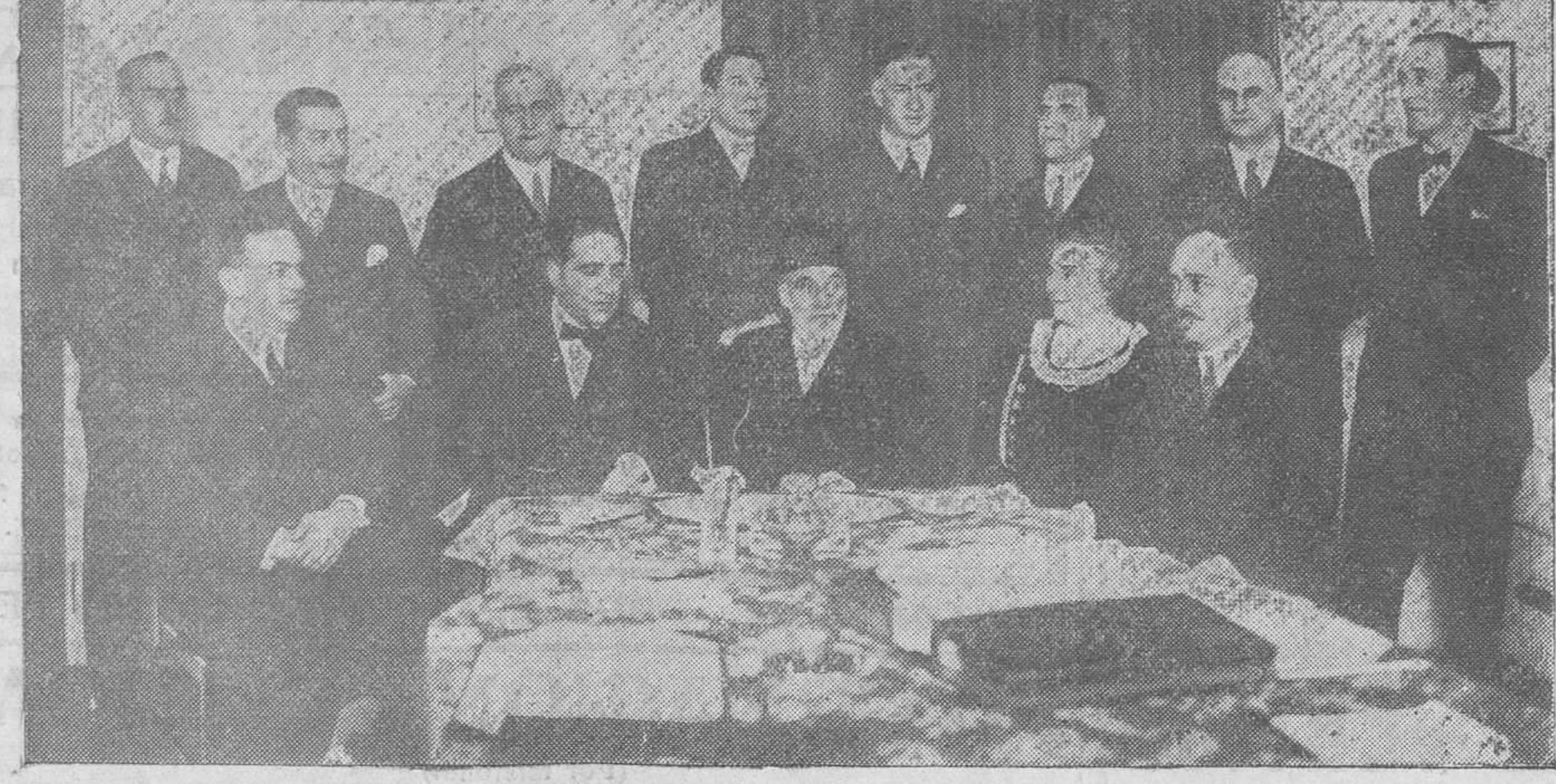
Una fotografía en la que se recoge una reunión del Patronato de la Casa de Salud Valdecilla, que fué presidida por el marqués de Valdecilla.

En estos últimos años, la figura venerable del señor marqués de Valdecilla era para los pueblos montañeses como la imagen de un santo taumaturgo cuya intercesión se implora en los momentos difíciles. En cuanto se trataba de realizar una obra buena, útil, necesaria, para todos beneficiosa, y se tropezaba con el inconveniente de la falta de recursos, se iniciaba la esperanza de lograr la protección del señor marqués de Valdecilla. Y como en peregrinación a Roma o a Santiago de Compostela, se iba a la casa del bienhechor, en busca del auxilio, de la protección, de la suma que se necesitaba. Y siempre volvían a sus pueblos los peregrinos con la aspiración lograda, y se realizaba rápidamente la