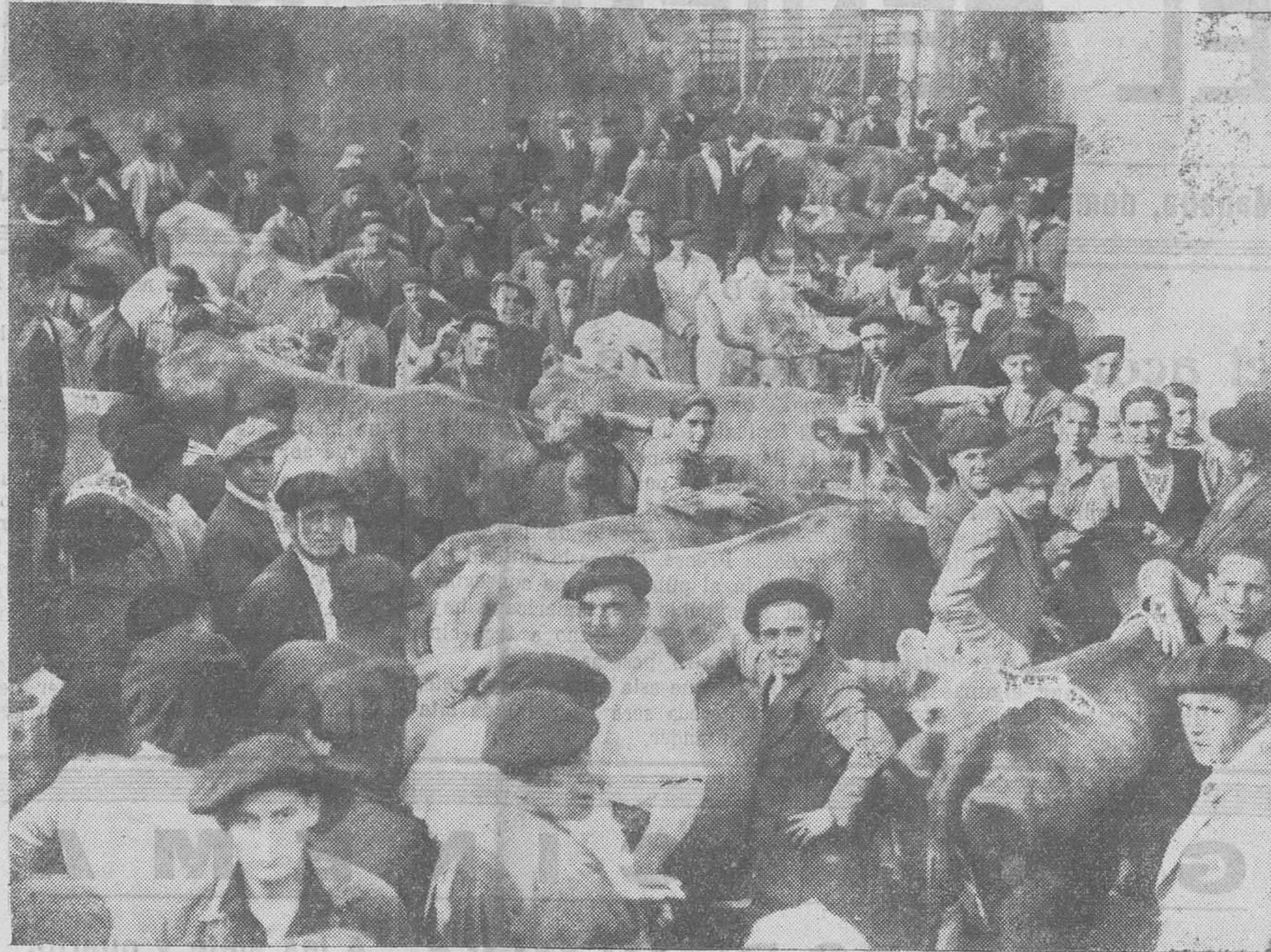
EN EL MATADERO MUNICIPAL. — Matarifes, ganaderos, carniceros y curiosos, esperando la hora de empezar el sacrificio de Pascua

Leopoldo Rodríguez F. Sierra MÉDICO RADIÓLOGO Especialista en Piel, Secretas y Radioterapia. Consulta de diez a una. - Muelle, 20. - Tel. 28-98.