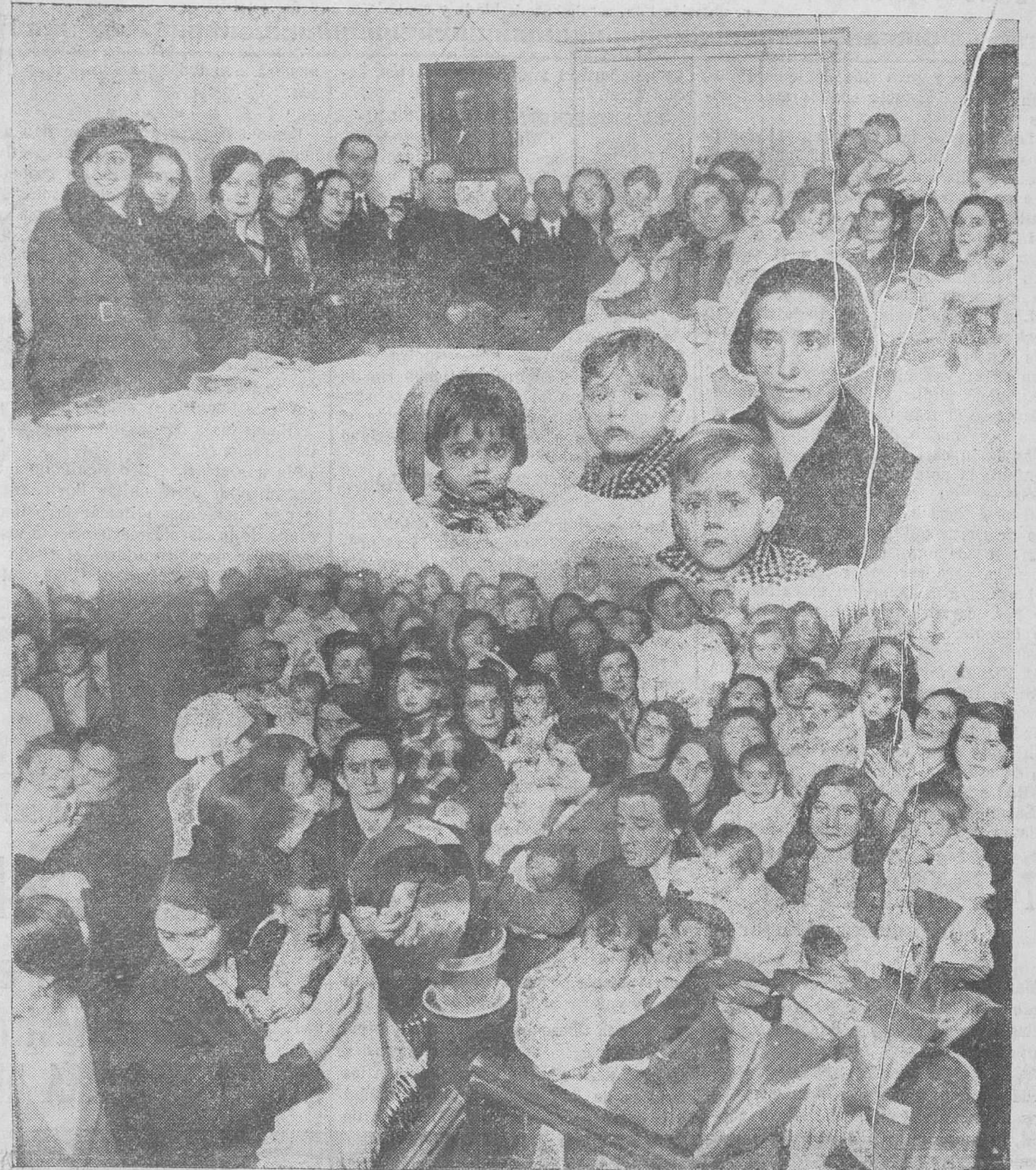
EN LA GOTA DE LECHE. — Dos momentos del reparto de ropas entre las madres que asisten a este acto benéfico. — En el centro, los tres hermosos mellizos nacidos en el paseo de Canalejas, hace dos años, con su madre, que los ha criado merced a la Gota de Leche

Merecen señalarse las pruebas de afecto y sentimientos humanitarios dados por los escolares santanderinos con motivo de las inundaciones que devastaron las poblaciones del Mediodía de Francia, iniciando y llevando a cabo una suscripción, cuyo importe enviaron a sus compañeros bordeleses, y con ocasión de la enfermedad y fallecimiento de uno de los estudiantes pensionados de la Escuela Superior de Comercio de Burdeos, en que dieron una prueba de sus afectos fraternales, sufragando los gastos de la enfermedad, provocando un entierro oficial, levantando un mausoleo sobre la tumba de su compañero,