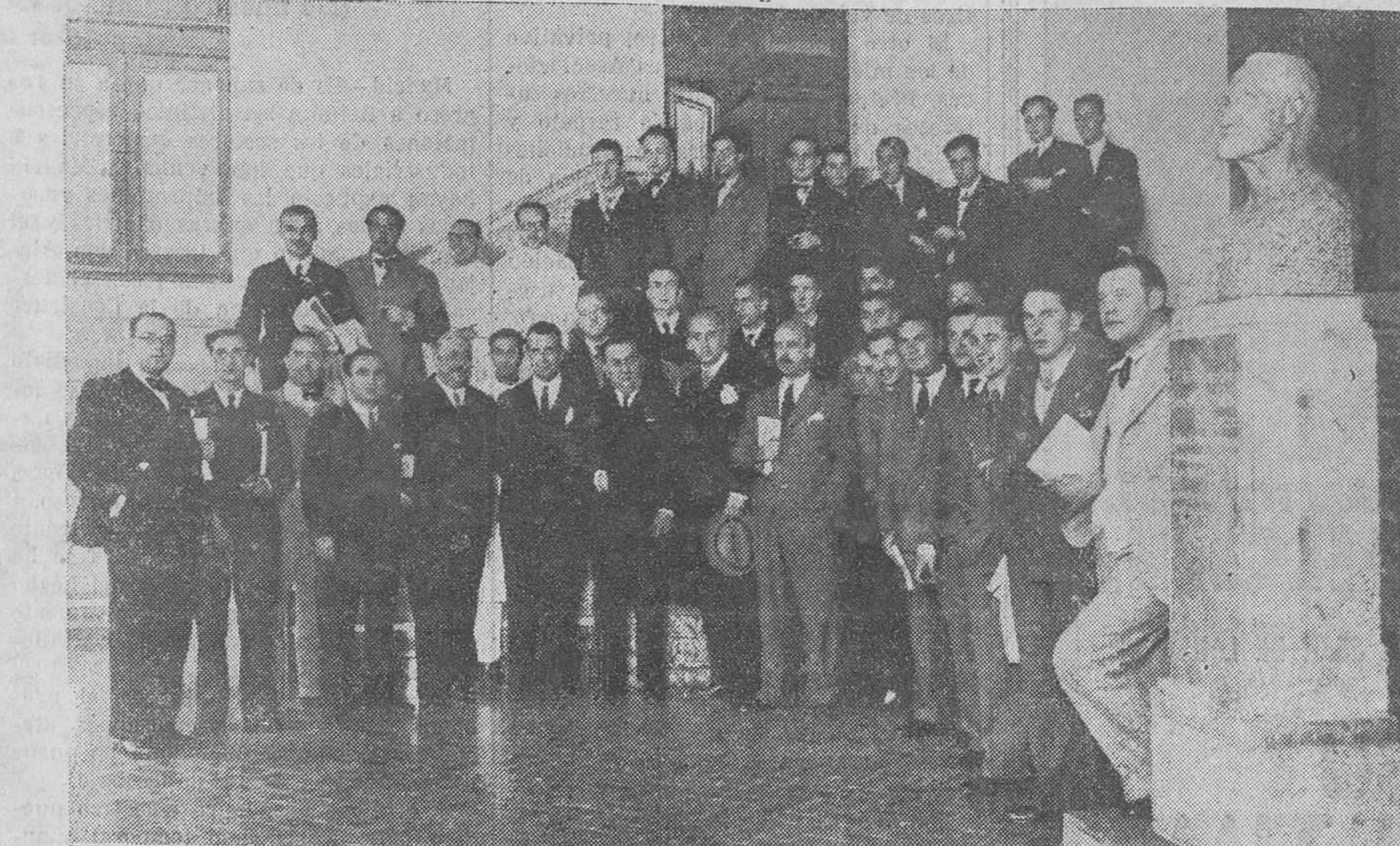
Los alumnos médicos de la Facultad de S. Prvago, rodeando el busto del marqués de Valdecilla, en el portar de la Casa de Salud del mismo glorioso nombre.

La obra queremos que sea de Santander, aunque a ella traigan aportaciones todos, desde el Estado hasta los