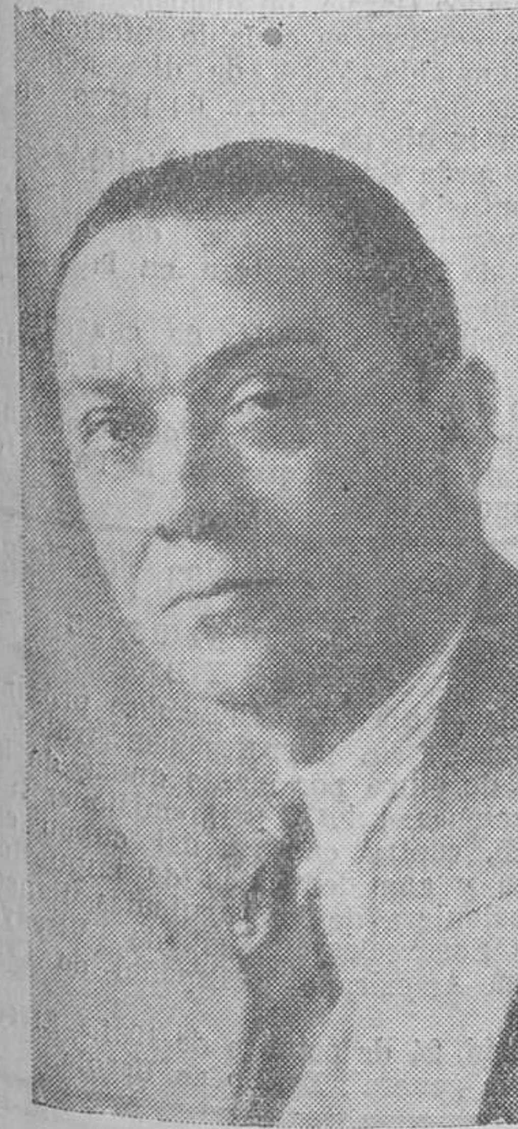
El distinguido primer actor y director de la compañía Saus de Caballé, Pedro Segura, uno de los más graciosos cómicos de la zarzuela española.