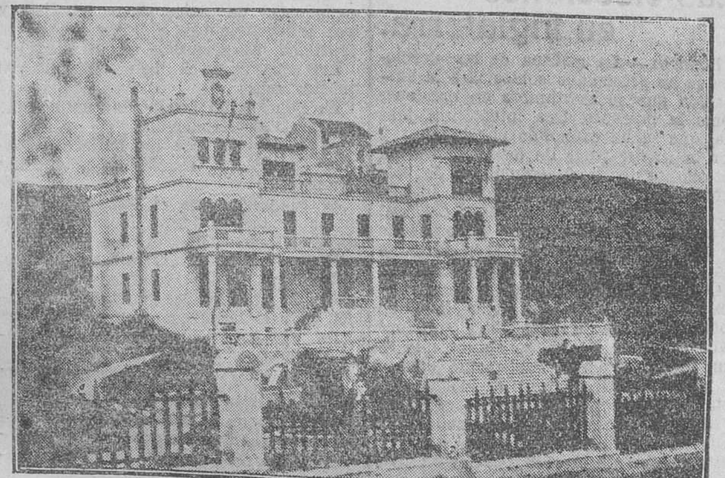
Este Sanatorio está principalmente destinado a las enfermedades de los huesos, músculos y articulaciones en sus afecciones tuberculosas, siendo de inmejorables resultados en los estados pretuberculosos, enfermedades de la nutrición, raquitismo, etc., etc. Su bella situación, hermosa instalación y confort le hacen ser uno de los mejores de España.