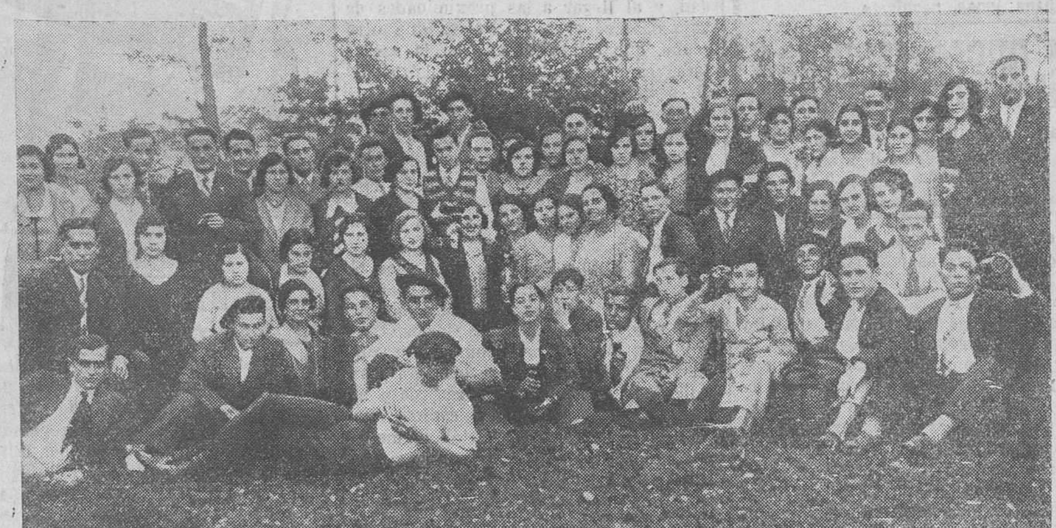
Una magosta, organizada por los alumnos de la Escuela de Artes y Oficios de Torrelavega.

A continuación, el alcalde de Madrid, don Pedro Rico, habló con el de aquella capital.